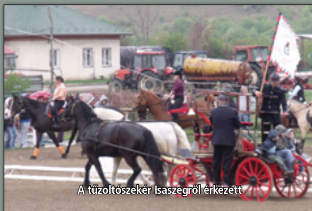
A tűzoltószekér Isaszegről érkezett