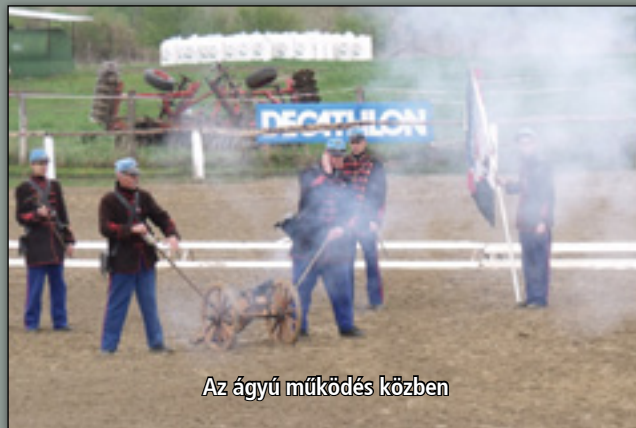
Az ágyú működés közben