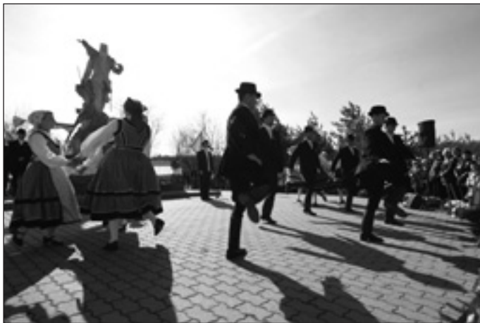
Csata táncegyüttes előadása

den, amire éppen felmerült az igény a lakosság részéről. Volt ezek közül, ami megszűnt, és jött helyette új, de akadt olyan is, ami kisebb kihagyás után újraindult. Azt gondolom, az a legfontosabb, hogy odafigyeljünk a változásokra, és mindenre nyitottnak kell lennünk.