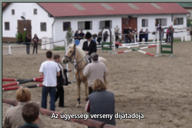
Az ügyességi verseny díjátadója