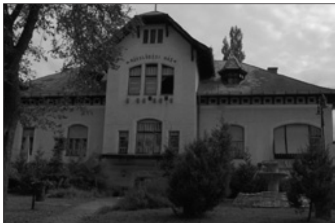
A volt Pekáry villa

Nevét az 1880-as évek közepétől többször említi Galgóczy Károly a könyvében (Pécel község leírása. 1896.) a Méhészkedők Társaságának vezetői között, a Vágóhid építése kapcsán és a Közművelődési Kör előadóinak névsorában is. Számomra mégis két másik apropó adja a legfontosabb okot Pekáry nevének ismertté válásában.