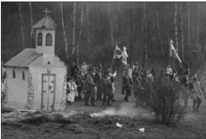
Pillanatkép az április 6-i csatáról

– Ezt csak jó csapattal lehet megtenni. Három szervező, gazdasági ügyintéző, takarítónő, és a múzeum munkatársa állandó csapattagok. Amióta a múzeum a városhoz került, szorosabban összedolgozunk a múzeum munkatársával és az Isaszegi Múzeumbarátok Körével. Ha már a segítőkéről szó esik, a civilek jelentőségét kell kiemelni. Az utóbbi években különösen megtapasztalható, hogy programjaink nagy része civil összefogással szerveződik, valósul meg. A város intézményeivel, szervezeteivel is kimagaslóan jó a kapcsolatunk. Ez nagyon hasznos, együtt könnyebben tudunk színvonalas progra-