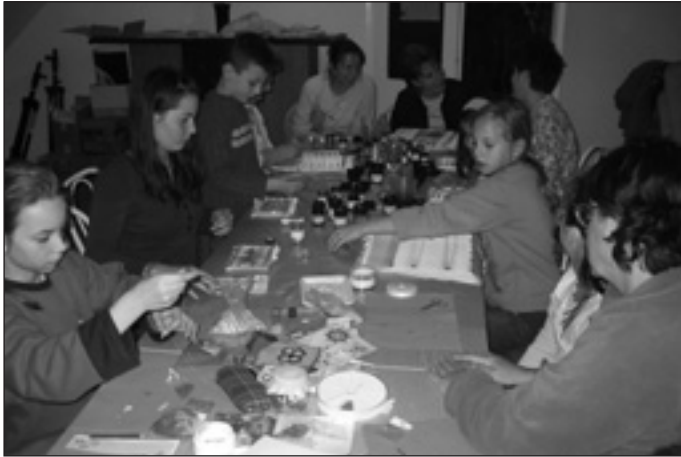
Festés a gyerekekkel