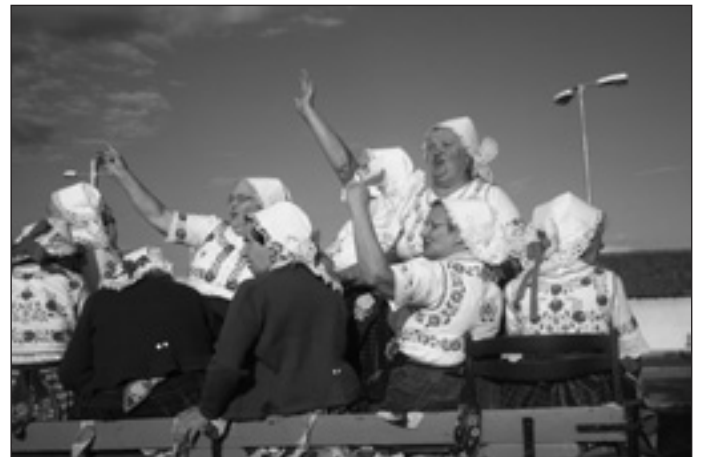
Az asszonykórus szekéren járja a várost