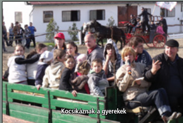
Kocsikáznak a gyerekek