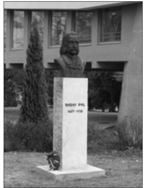
Ráday Pál szobra új helyen

– Az ifjúság szerintem nem változott. Ugyanúgy nyitottak, ugyanúgy leesik az álluk, ha mond valami érdekeset az ember. Hidd el, legeslegjobb a diákok között lenni. Ez az őszinteség és nyitottság a felnőtt világban már nincs meg. Hidd el, nincs annál jobb, mint mikor harmincöt ember figyel rád. A szabályok és kötelezőségek felett van az a szuggesztív hatás, amellyel megtartod a gyermekek figyelmét, tekintetét a tanórákon, és amely vissza tud hatni a példa tekintélyével a szabályok betartására is. A gyermeki őszinteség visszajár, talán ez adja hitelét a tanárnak.