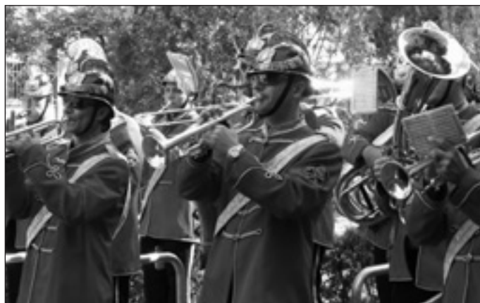
Központi Tűzoltózenekar (új nevén: Katasztrófavédelem Központi Zenekara )

Az ekkor megalakult tűzoltóegyesületek komoly társadalmi presztízzsel rendelkeztek. A polgári önszerveződés, öngazgatás megformálói erkölcsi elismerést kaptak, a tűzörségi tevékenységeken túl a települések életének, közrendjének megszervezésében is részt vettek. A polgári állam kiépülése, törvénykezése szervezeti keretet adott a működéshez, amelyhez az anyagiakat helyben kellett előteremteni. Szabály- és vizsgarendek alakultak ki, amelyek a mai napig fellelhetőek. Az 1948-at követő tanácsi rendszerben a nagyobb területi egységeknél, városoknál az állam vállalta a fenntartó és szervező szerepet, csak a kisebb településeken, falvakban engedte az önkéntes tűzoltás megszervezését, vagy a tanácsok kezébe adta a koordinációs, fenntartó feladatot.