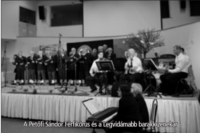
A Petőfi Sándor Férfikórus és a Legvidámabb barakk zenekar

A reggel hűvös volt, és a felkelő nap vakító sugarait báránnyel felhők gyülekezése homályosította el. Március idusa ellenére kellett a meleg kabát, a könnyű selyemsál és jól látható, büszke helyre a kokárda, ünnepelni indultam. Szeretem ezt az ünnepet, ma már igen. Ma nem a kötelesség, hanem a kíváncsiság érzésével szívemben mentem, szabad akaratomból, vidáman.