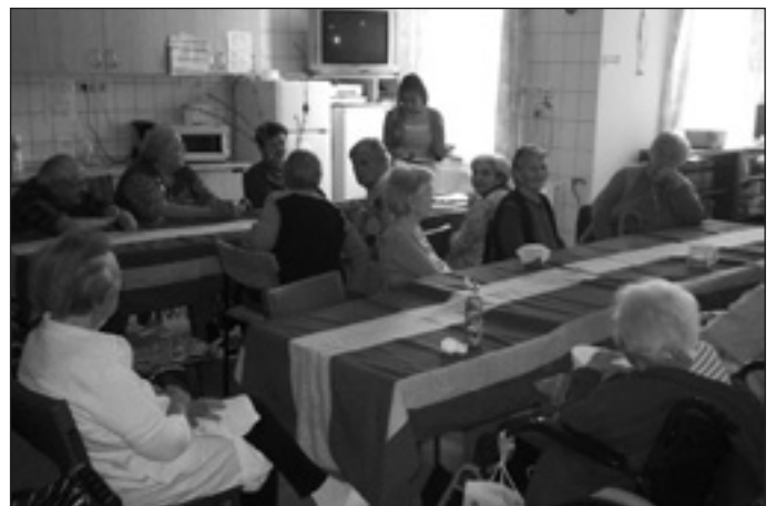
Vetélkedő az isaszegi ápoló otthonban

Egyre betegebb emberek érkeznek hozzánk. Régebben természetes volt, hogy az idősök is családban, nagycsaládban éltek, és mindig volt körülöttük valaki, ha szükségük volt a segítségre. Az idős emberek lelkiismeretes ellátása manapság nagyon nagy terhet ró lelkileg is a családokra. És sok esetben