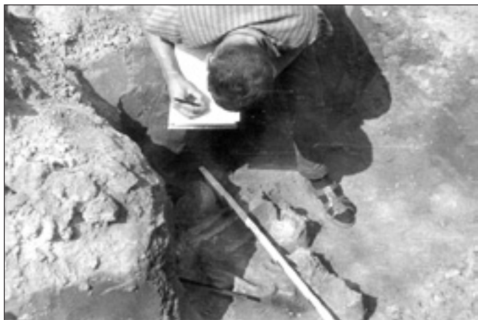
Régészeti munka a Thököly utca 7. leletmentésén