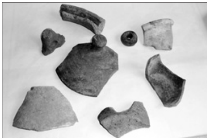
Szórványok a József A. utcából

Azt majdnem kifelejtettem, hogy őskori anyagokból már elég jelentős régészeti gyűjteményem volt a bevonulásom előtt. Igaz, csak szórványokból, azaz cseréptöredékekből, de azok nyújta-