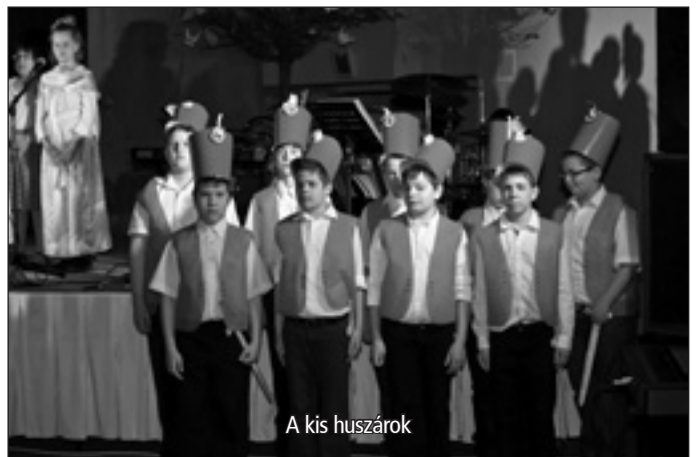
A kis huszárok