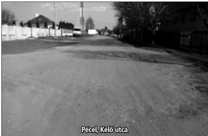
Pécel, Kelő utca

Nem vagyok törzsgyökeres, az itteniek úgy mondják: őslakos. Családommal 3 éve költöttünk Pécelre. Amikor a lakcímkártyámra bekerült a Kelő utca cím, nem is gondolkodtam rajta, hogy van-e jelentése ennek a szónak. A minap az ismerősökkel beszélgettünk arról, hogy mit szeretnek, illetve nem szeretnek a Kelőben lakók. Ekkor merült fel a kérdés, hogy mit is jelent, honnan ered a név?! Senki nem tudta, nem is érdekelte, hogy miért így hívják az utcát, ahol a házuk van, amit sokszor kimondunk, ha hivatalban ügyet intézzünk, vagy orvosnál szinte az első kérdés – milyen utcában lakik. Itt az alkalom, hogy a Kelő utca lakói illetve a Kelő lakosai megtudják, mit is takar ez a név. A kutató munkámban igen nagy segítségemre volt Juhász József anyaggyűjtése a terület történetéről.