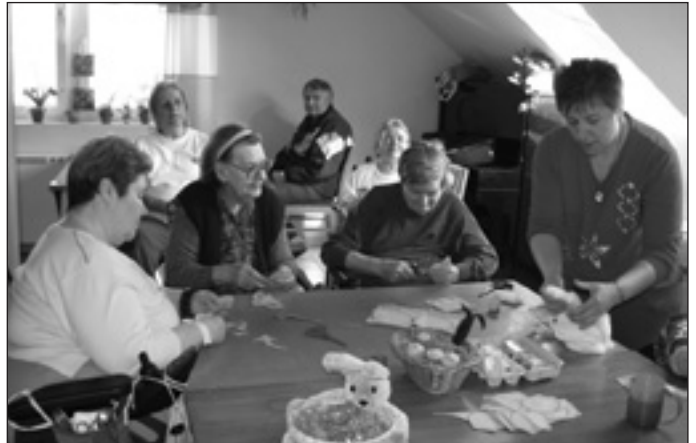
Készülnek a húsvéti hímestojások a péceli otthonban