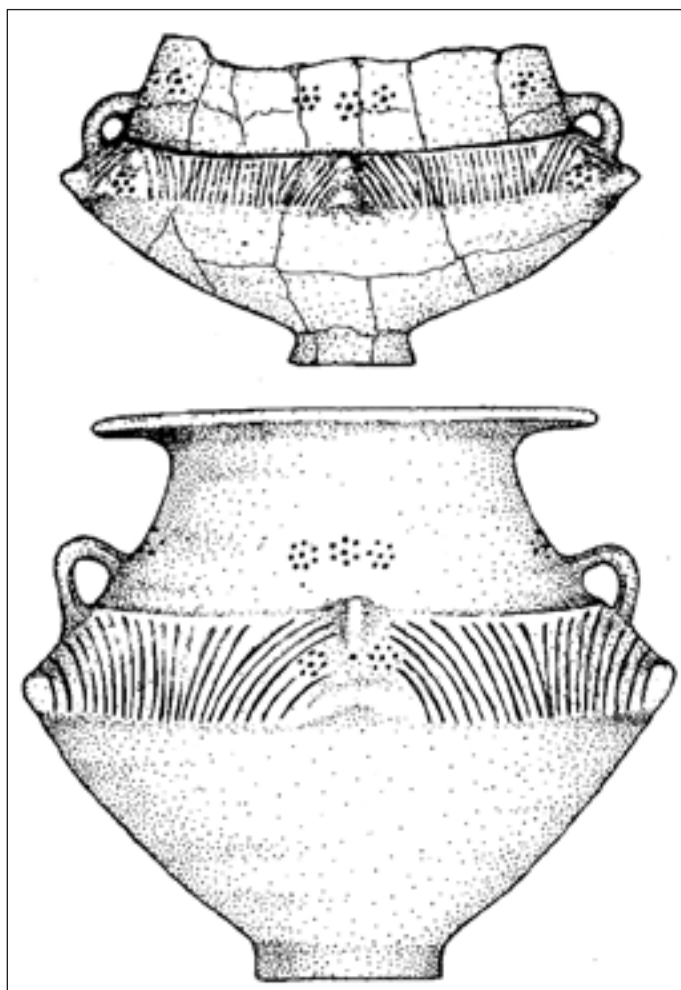
Általam restaurált bronzkori lelet a Bem utca 3-5. sz. alól

Időközben megszűnt a Vízársulat, s olyan munkahelyre kerültem, ahonnan csak hétvégeken térhettem haza. Közben megnősültem, családot alapítottam, de továbbra is érdekelt a régészet.