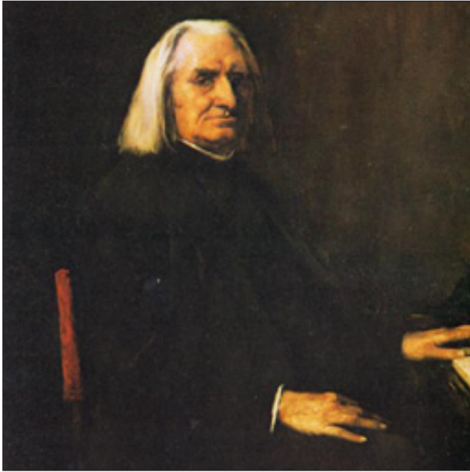
Liszt Ferenc (Munkácsy Mihály festménye – 1886)

Liszt Ferenc a XIX. század egyik legnagyobb zongoraművésze, merészen újító zeneszerző, karmester, zenei író, nagy hatású pedagógus. Magyarország hűségese szülötteként nyitott volt számos más európai ország kultúrája iránt is, amelyekkel mozgalmas élete során kapcsolatba került, mindenütt jelentősen hozzájárult a zenei kultúra fejlődéséhez.