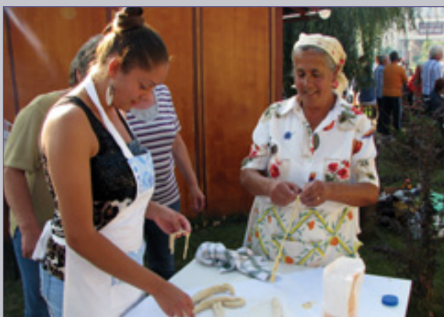
Egyedi módon készül a tészta