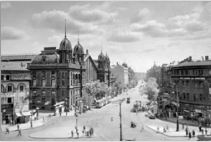
A Nagykörúton a villamosok az út két szélén (1935.)

te el a folyó. Pesten a lezárt csatornák vizét gőzszivattyúk emelték a Dunába.