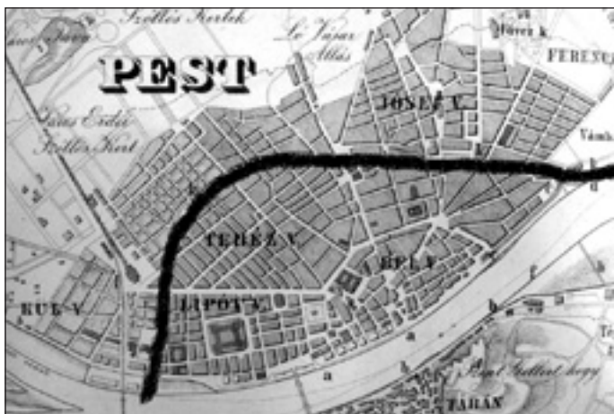
Az elképzelt Duna-csatorna

Reitter terve szerint épült meg a pesti oldalon a Dunába torokló, csatornákat összekötő első gyűjtőcsatorna, amely lehetővé tette a csatornák árvízi elzárását. Ez már az 1876. évi árvízkor megvédte Pestet, míg Budát ismét a csatornákon keresztül öntöt-