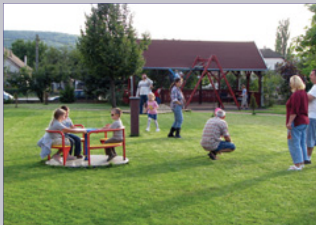
Játszóter a kicsiknek