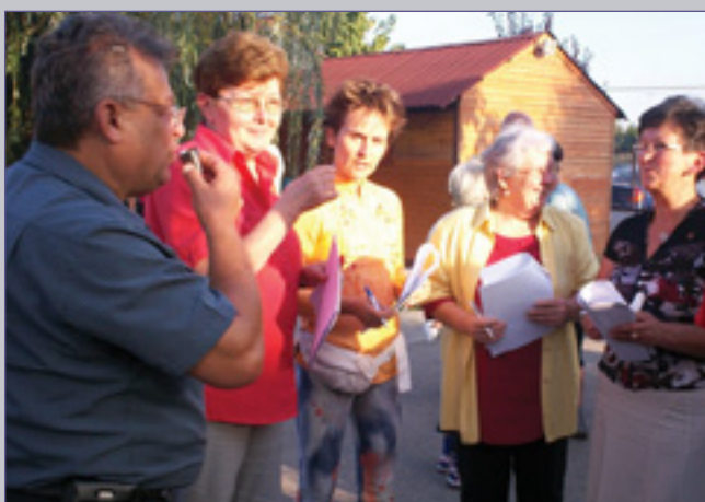
Bemelegít a zsűri