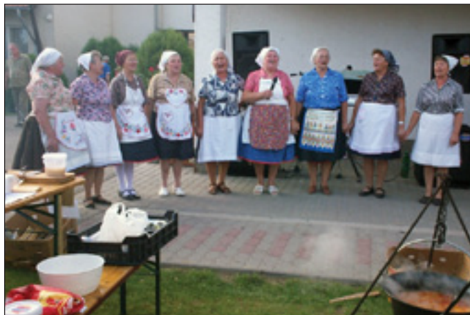
AZ Isaszegi Asszonykórus

A Kelmemesterek „Cigánytészta” ételle fantasztikus készítési móddal készült, csirkehúsos, lecsós tészta.