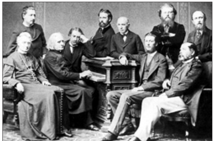
Liszt Ferenc tisztelői körében munkássága ötvenéves jubileuma alkalmából, 1873

1869-től kezdve Liszt ismét sokat utazott, de alapvetően három város: Weimar, Róma és Pest között osztotta meg életét.