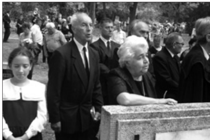
A szertartás résztvevői

Alázatos és szerény ember volt, de éppen erre az egyszerű értékrendre alapozva mindig mindenkivel szemben határozott,