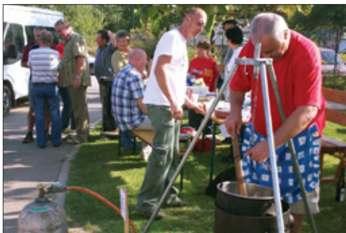
Készül a "Jászágó tokány"