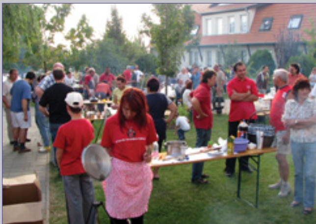
Főzőtér a nagyoknak