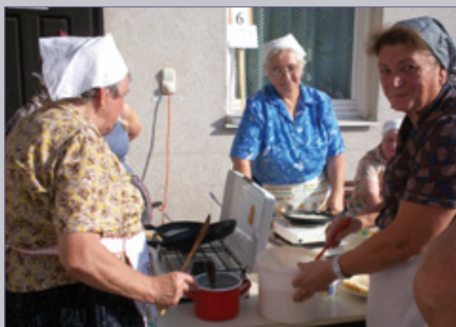
Készülnek a különdíjas palacsinták