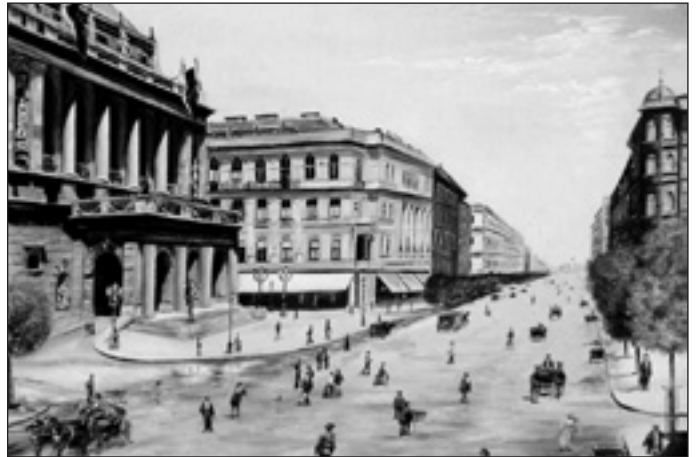
A Sugár út az Operaházzal (1900.)

A nagykörúti házak építészeti kialakítására az Andrássy úti mágnás-, és bankár-palotákkal szemben a jómódú polgárság ízlése hatott, így a mai épületek zöme eklektikus stílusú.