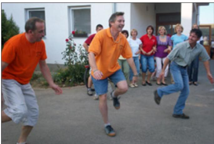
A Csatangoló Táncegyüttes

Különdíjat kaptak az Asszonykórus a fantasztikus mennyiségben, sokféle töltelékkel készült palacsintákért, melyeket a zsűrinek énekszóval és verssel tállaltak.