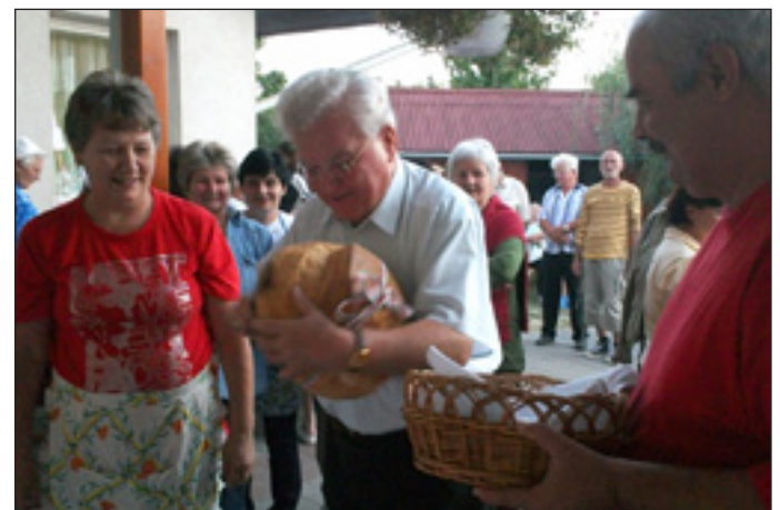
Gulyka atya megajándékozza a zsűri tagokat a főzőversenyen.

Az Ügyi csapat „Gombócleves”-t és harcsapörköltet készített