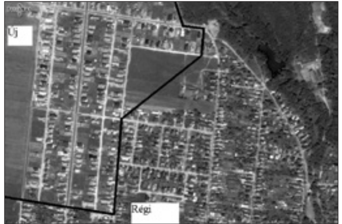
Beépítések közötti különbségek

Leírás: Mivel a város a szuburbanizáció következtében gyors ütemben épült be, és a város minden szabad területét lakócéllra használták fel, Pécelen kevés a köztér, azok is sűrűn körbe vannak építve.