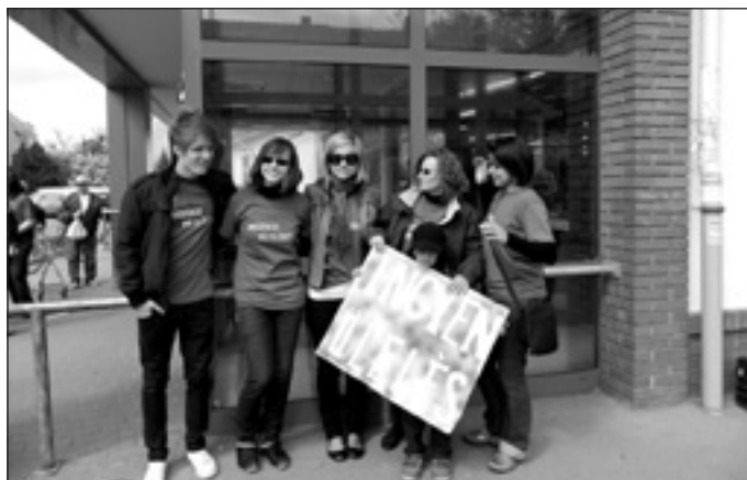
Önkéntesek és szervezők