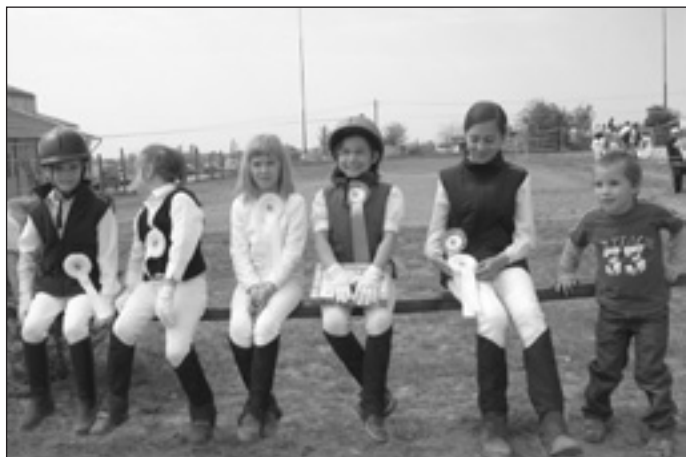
A Talentum-kupa péceli csapata

Kellemes tavaszon kirándulók serege lepi el a péceli emlékpark környékét. A Kistáltos póniklubban is sorakoznak a gyerekek, lovakat ápolnak, nyergelnek, gyakorolnak. Kezdődik a lovas szezon. Persze nem csak a tavasz alkalmas a lovaglásra, hanem minden évszak, de a téli erős fagyokban csak az igazán kitartóak ültek lóra.