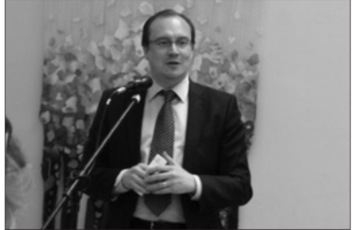
Jari Vilen nagykövet nyitóbeszédet mond

A kiállítás ünnepélyes megnyitójára április 28-án 17 órakor került sor, melynek rangját emelte Jari Vilen, Finnország magyarországi nagykövetének rendkívül szuggesztív, értő nyitóbeszéde.