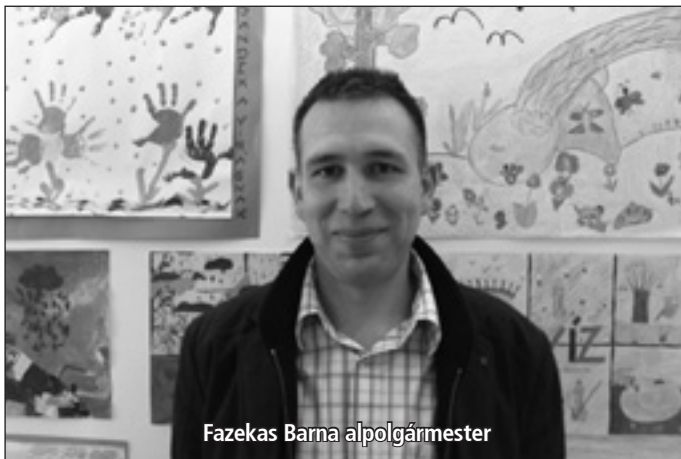
Fazekas Barna alpolgármester

A Péceli Hírhatár Online megkérdezte Fazekas Barna alpolgármestert, aki harmadik generációs péceliként ismerve, látva a város problémáit vágott neki Szöllösi Ferenc polgármesterrel és független képviselőtársaival a hatalmas feladatnak: megállítani az eladósodást és rendbe szedni a település gazdálkodását. A kezdeti intézkedések kedvező visszhangja, mondja Fazekas Barna, megerősítette abban, hogy jó irányba megy a csapat.