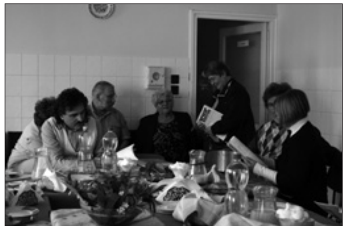
Nézegettük az első és a legutóbbi lapszámokat

„A különleges elismerés azokat az önkéntes újságírókat kí-