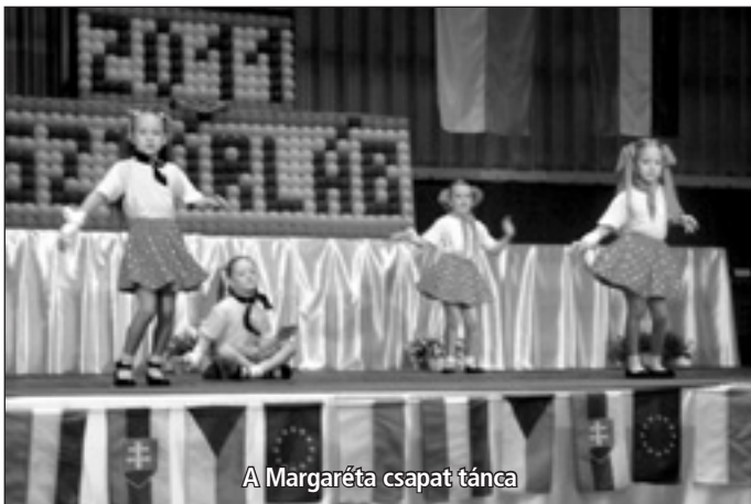
A Margaréta csapat tánca

Az Isaszegi Szlovák Kisebbségi Önkormányzat felhívására nagyon sok versenyző jelentkezett a II. SztárLáb modern táncversenyre és a fesztivál gálájára.