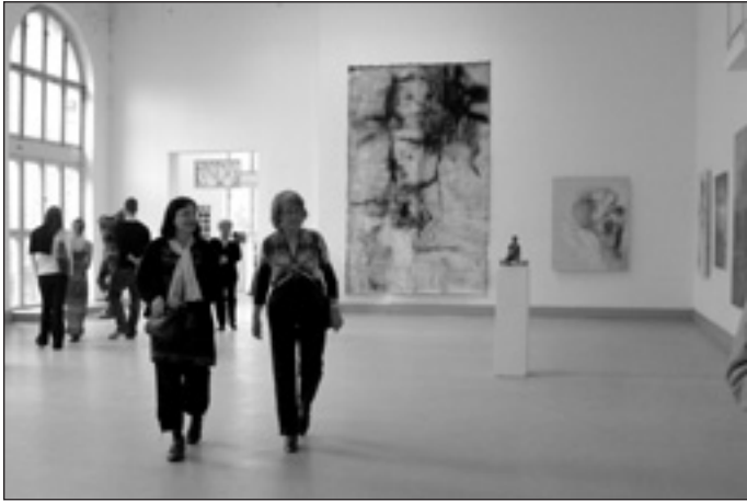
A kiállítás részlete

2011. április 25. és május 1. között Iisalmiból, Pécel finn testvérvárosából és környékéről 18 művész érkezett hozzánk. Öten Pécelen laktak Jelenikéknél, a többiek Budapesten.