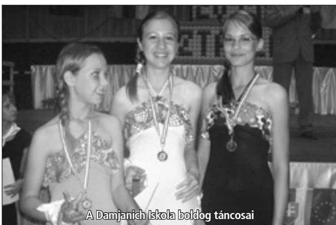
A Damjanich Iskola boldog táncosai