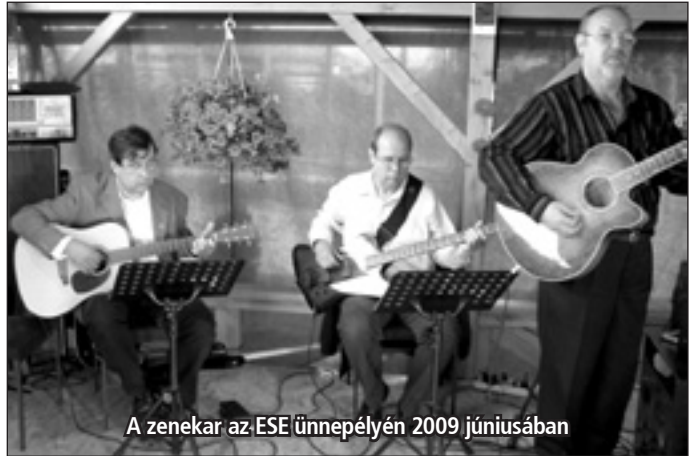
A zenekar az ESE ünnepélyén 2009 júniusában

Hiányzik ehhez egy ember. Általában a próbákon és a fellépéseken úgy csináljuk: beállítjuk nagyjából, ahogy gondoljuk, hogy jó, aztán a visszajelzések alapján módosítunk rajta, ha kell. Reméljük, hogy április 10-én ezzel nem lesz gondunk.