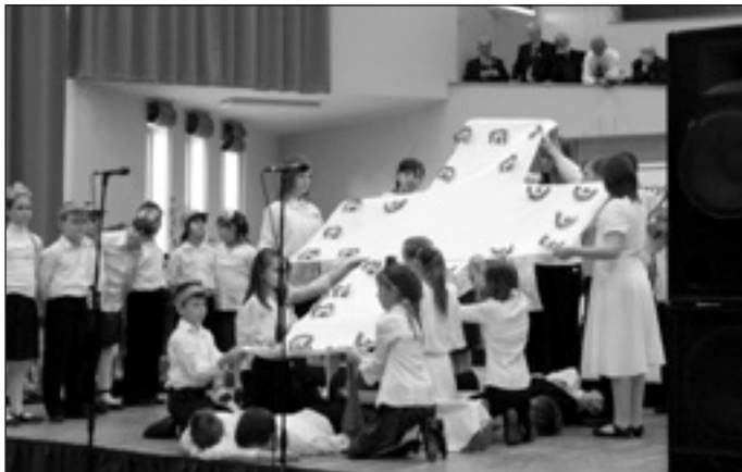
Az iskolások előadása

„Forradalom miatt gyűltünk össze, múltunk dicsőséges forradalma miatt.