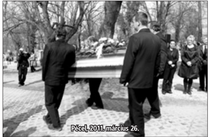
Pécel, 2011. március 26.