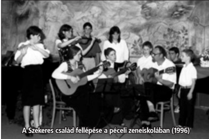
A Szekeres család fellépése a péceli zeneiskolában (1996)