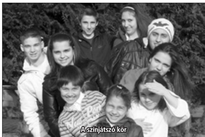
A színjátszó kör

Pécel Város Cigány Kisebbségi Önkormányzata 2008 novemberében megálmodott egy programot, melynek keretében a város gyermekeit közelebb hozza a színjátszáshoz, a filmezéshez.