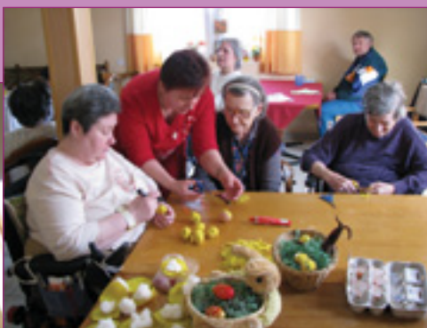
Sok a dolog!