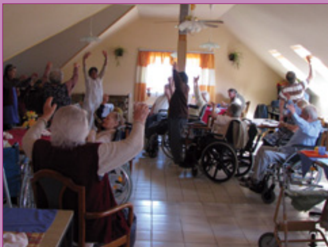
Egy kicsi mozgás