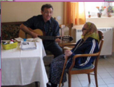
A zene az kell!