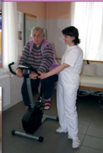
Nem kell félni, nem fáj!