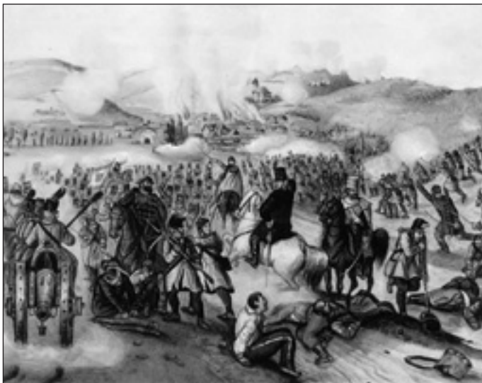
Az isaszegi győztes csata

Még gyönyörűséges tojások festésére is lehetőség kínálkozott.