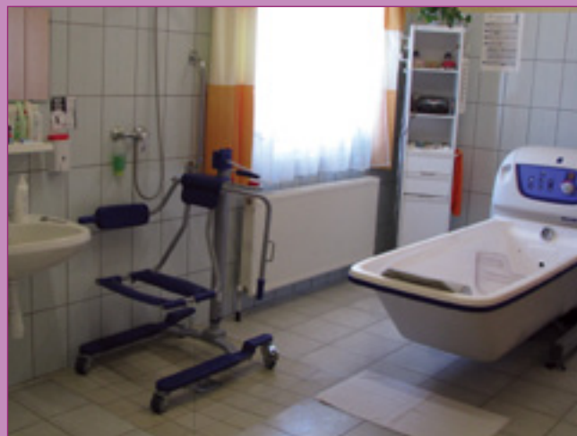
Vár a hidromasszázs Pécelen