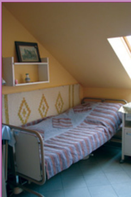
Egy ápoló szoba