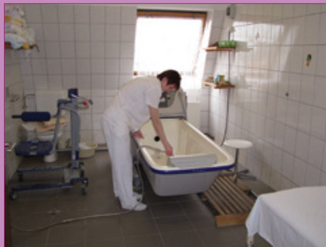
Vár a hidromasszázs Isaszegen