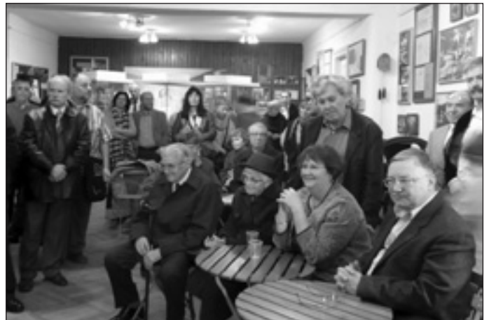
A kiállítás vendégei