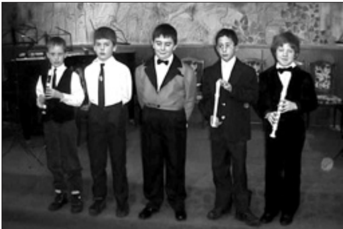
Ma már felnőttek

Bár iskolánk pedagógiai programja alapján elsősorban nem az a célunk, hogy zenészeket „gyártsunk”, mégis büszkék vagyunk