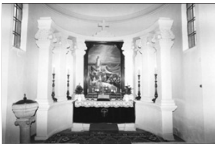
Az evangélikus templom oltára

Fogalmazásom közben döbentem meg: nem is biztos, hogy ez az én templomom. Hiszen nem én építettem, nem én hoztam érte áldozatot! Bár találkoztam építőivel is, mégsem az enyém, hisz ők Isten dicsőségére építették, nagy áldozatvállalással. Én csak örököltem. Használhatom, vigyázhatok rá, de nem az enyém. Ezt kaptam emberek áldozatvállalásán keresztül, de Is-