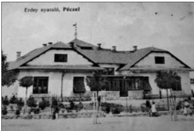
Az iskola épülete régi képeslapon