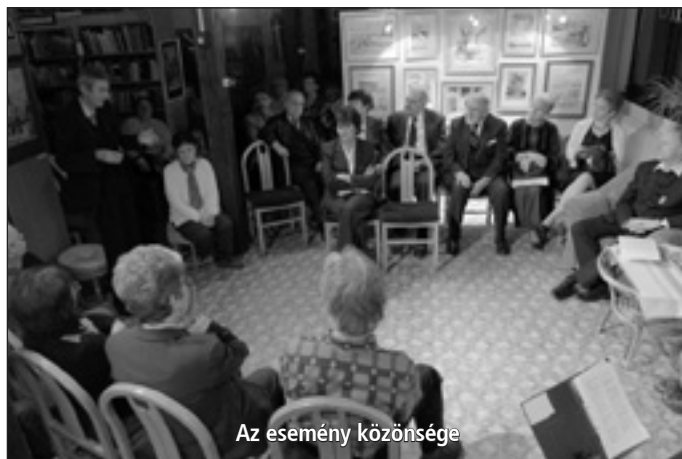
Az esemény közönsége