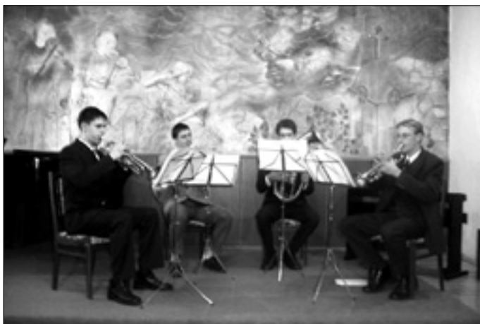
Jó volt együtt zenélni

Az épületben 1 iroda van, mely magában foglalja az igazgatói, igazgatóhelyettesi, iskolatitkári, valamint a tanári szobát is. Egy külön kis helyiség – 3 m 2 – szolgál kávézásra, étkezésre. A szünetek idején a növendékek az aulában tartózkodnak, melynek alapterülete: 40 m 2 .