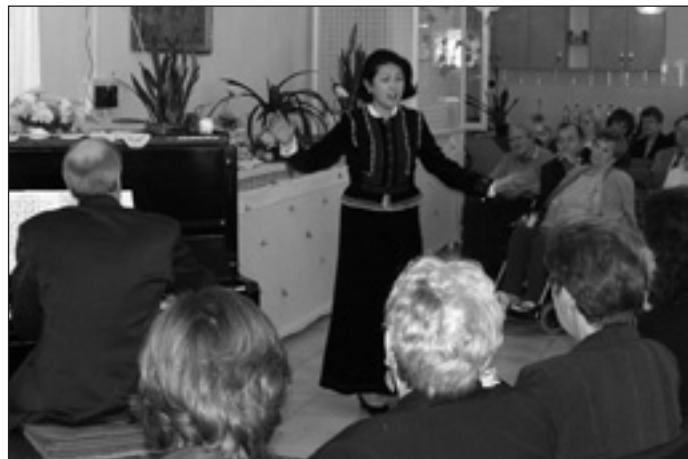
Pillanatkép a koncertről