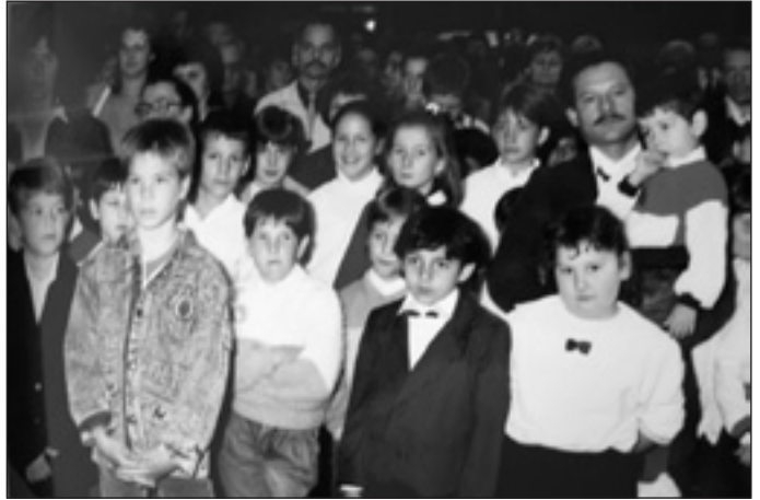
Az első rendezvény közönsége

jezésének egy módja, ami szintén egy tréning. Már az egy-két évig tartó zenetanulás is javítja a memóriát és a figyelmet, ezt az agy elektromos és mágneses impulzusait észlelő vizsgálatával bizonyították. Ennek az lehet az oka, hogy amennyiben más emberekkel együtt zenélünk, rengeteg figyelem, memória és a mozgulatok pontos irányítása szükséges az ehhez szükséges motoros (mozgató idegrendszeri) és hallási képességekhez. A zenetanulás