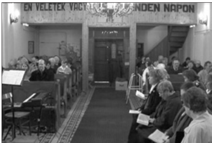
Hívek az istentiszteleten

A hely sem elhanyagolható. Mintegy 100 évvel korábban a „péczei” lutheránusoknak a M. Kir. Helytartóság egy – akkor mocsaras, szinte megközelíthetetlen – telket ajánlott fel a Koldusvölgy (ma Völgy utca) területén. Regényes levelezgetések tanúskodnak arról, hogyan kerülhettünk mégis a falu-község-város kellős közepére.