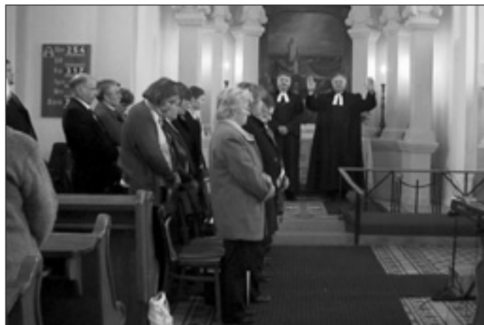
Az ünnepi istentisztelet

A 30-as évektől kezdődően a péceli lelkész szolgálata kiterjedt Rákoscsaba és Isaszeg gondozására – péceli központtal. Ez a szervezeti összetartozás 1981-ben bomlott fel, ettől kezdve a