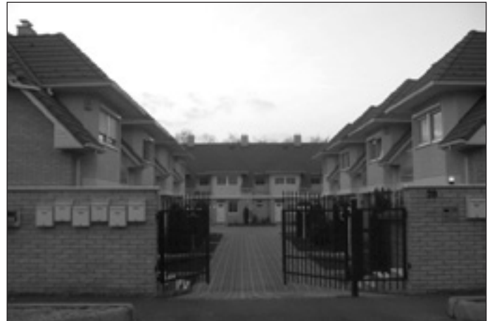
A vizuális-esztétikai konfliktusok jellemzői

Iparterületek képe: Pécel nyugati részén ipari park létesült, valamint ipari telepet terveznek létrehozni a Bartoshegyi-dűlőn és a Kelő-dűlőn is. A meglévő telep nem illeszkedik a település képébe, épületei kiemelkednek a földszintes házak közül, valamint modernebb stílusával eltér a lakóházak egyszerűbb, hagyományos építési módjától. Az új, északi telep a nyugatról érkezők szemé elé táruló lakóövezeti látványt cserélné ipari képre, a bartoshegyi telep pedig a település legmagasabb pontjait érintené,