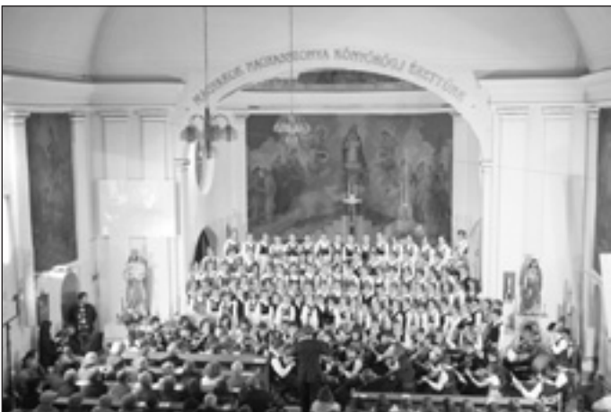
A hatalmas kórus a katolikus templomban

Készülődésüket nézve kiderült számomra, hogy egy fegyelmezett, rendezett, összeszokott csapat készíti elő koncertjét. A katolikus templom – ahogyan Ferenc atya is elmondta köszöntőjében – még soha nem fogadott ekkora kórust. A tekintélyes létszámú csapat és előadásuk nyomán a hallgatóságban felgyülemlett érzelmek hamar fölmelegítették a templomot. Lenyűgöző látványt nyújtott a 100 fős, székely ruhába öltözött énekkar, és hangjuk teljesen megtöltötte az imádkozás terét. Dalaik is olyanok voltak, mint egy-egy ima, amely azért hangzik el, hogy kopogtasson az emberek szívében, és ha megérintette őket, könnyeket csaljon a szemükbe. Történelem, humor, játékoság, gyász és a jelen