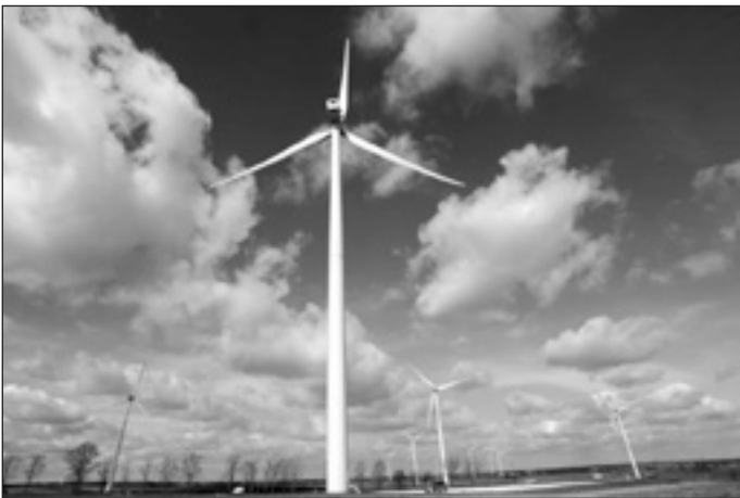
Egy szélerőmű Magyarországon

– A település gyenge civil környezet- és természetvédelmi aktivitása