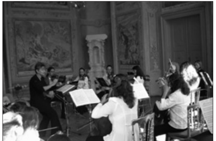
Koncert a kastélyban

tek, jó kedv és hihetetlen mennyiségű zenekari gyakorlás... és a fantasztikus záró Békekonzert!!! Mert ezt az egész találkozót a II. világháború tragédiái hívták életre: nemcsak a porig bombázott város, de a Kelet-Európából neumarkti munkatáborba deportált – és a bombázás alatt meghalt munkaszolgálatos – emberek emléke az, amely újra és újra erőt ad a szervezőknek. Ahogy ők mondták: a fiatalok nevelése és a barátságok által kell elérni, hogy többé ne legyen háború, ne legyen ilyen tragédia. Elmondható: minden erejükkel segítették, hogy jól érezzék magukat a résztvevők, hogy a barátságok kialakuljanak, és tovább szövődjenek. Köszönet érte a szervezőknek, városunk képviselő-testületének és a szponzoroknak.