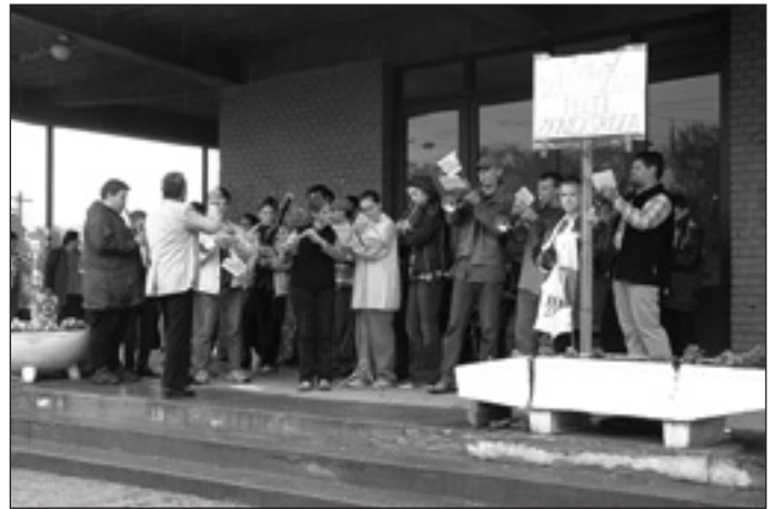
A zenekar a péceli vasútállomáson