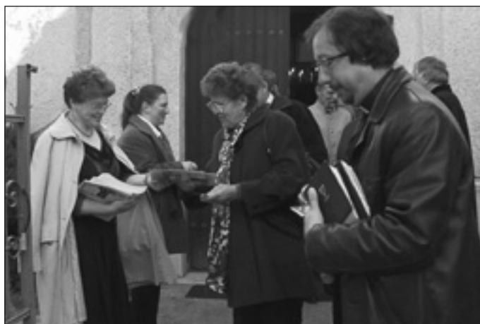
Beszélgetések a templom előtt

Az iskola és templom céljára »szükséges fundusnak kijelölé-