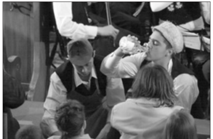
Pihenő a Petőfi Iskolában

A koncert után az együttes visszatért a Petőfi Iskolába, és nagyon jó hangulatú táncházat tartott. A középre állt négy legény – három hegedűs és egy bőgős – fáradhatatlanul húzták a nótát, úgy tűnt, hogy a gyantától behavazott hangszerek és az izgatottan pattogó vonók egyre-másra visszapöndörődő szálai előbb adják meg magukat, mint az ő lendületük. Többször emlegettük