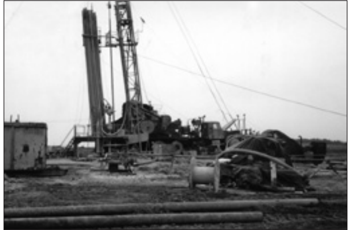
Termálkút fúrása – 2002. március

– jelentősen megnő az ismertsége, és új iparág – a turizmus – fejlődik ki, ezáltal az egész város is megújul,