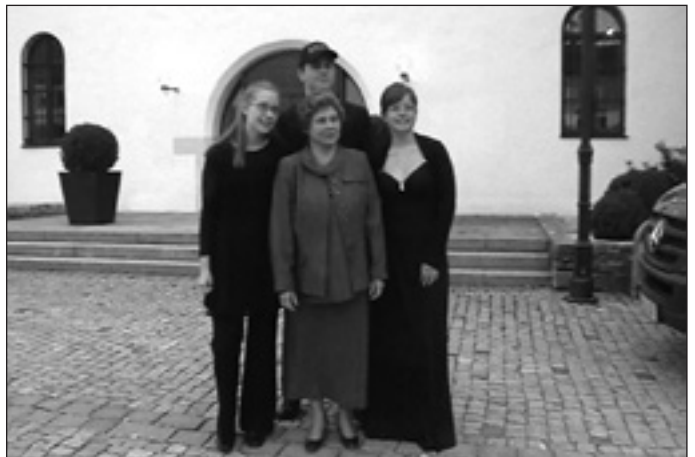
A péceli küldöttség Neumarktban

Azt gondolom, mindannyian vágyunk rá, hogy eredményesek legyünk. Ez talán még inkább igaz a gyermekekre, akiknek a siker szárnyakat adhat. Ám egy-egy jó szereplés után a büszkeséget nem csupán a tanulók érzik, hanem szüleik és tanáraik