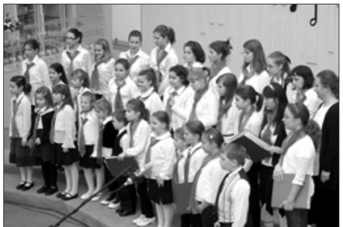
A Péceli Gyermekek és Ifjúsági Kórus

Isten éltesen hát minden olyan emberi közösséget, ahol az emberek odafigyelnek egymásra, együttműködnek, önként alá-