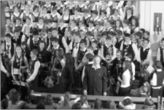
A Szentegyházi Gyermekfilharmónia és karnagya

tele között. A mintegy háromszáz főnyi küldött, a 140 gyermek és a jelenlévő kísérők együtt énekeltek a magyar és a székely himnuszt, valamint székely népdalokat. Egy előre nem tervezett, ám annál jobban sikerült harmadik fellépés is követte az első kettőt: ugyanennek a napnak az estjén volt a Nemzetközi Protokoll Kongresszus, melynek záró vacsoráján a Vadászteremben egy 40 perces koncerttel lépett föl az együttes. A jórészt latin nyelvterületről érkező hallgatóság felszabadult ünnepléssel és ovációval fogadta a produkciót.