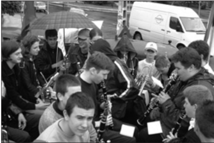
A zenekar a teherautó platóján