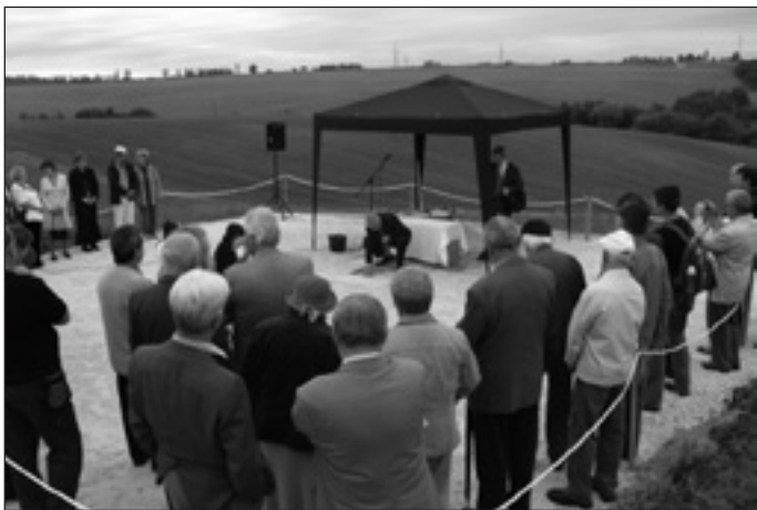
Termálfürdő alapkőletétele – 2010.

Pécel város természeti környezete, a kellemes klíma, valamint a budapesti agglomerációban betöltött szerepe alkalmassá teszi egy jelentős idegenforgalmi beruházás megvalósítására. Ennek alapja, a természet mellett, a fellelhető termálvíz hasznosítása. A várost rendkívüli módon felértékelheti, ha jelentős vonzáskörzetéből üdülni vagy hosszú hétvégét eltölteni családok érkeznek a városba. Az önkormányzat 3,5 ha területű földrészletén, összhangban a rendezési tervvel, megvalósítható ez a több száz munkahelyet is teremtő beruházás.