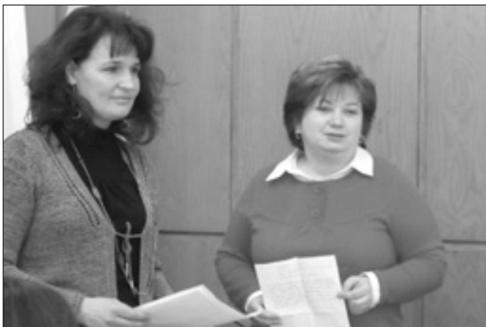
Az óvodák közös projektindító napján

A század elején világviszonylatban kiemelkedő magyar közoktatás megalapozta, hogy a világot átformáló magyar tudósok sokaságát adjuk a világnak, egyben a legmodernebbek közé is tartozott.