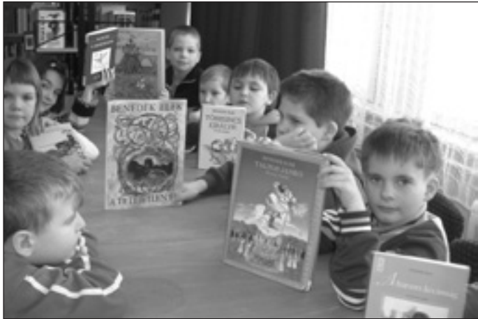
A gyerekek mesekönyvekkel

A 2009/2010-es tanévben került sor iskolánkban a kompetenciaalapú oktatás bevezetésére. A TÁMOP-3.1.4-08/1 pályázat elnyerése után iskolánkban is elkezdődött az előírt feladatok lebonyolítása. A pályázat tartalmazta a témahét, a három hetet