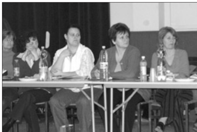
Projektindító napon a Damjanich János Általános Iskolában

Az örömben sajnos bosszúság, hogy 2009. augusztus végéig kellett volna tájékoztatást kapnunk a pályázati eredményről, a valóságban ebből november lett. Ráadásul a szükség és el-