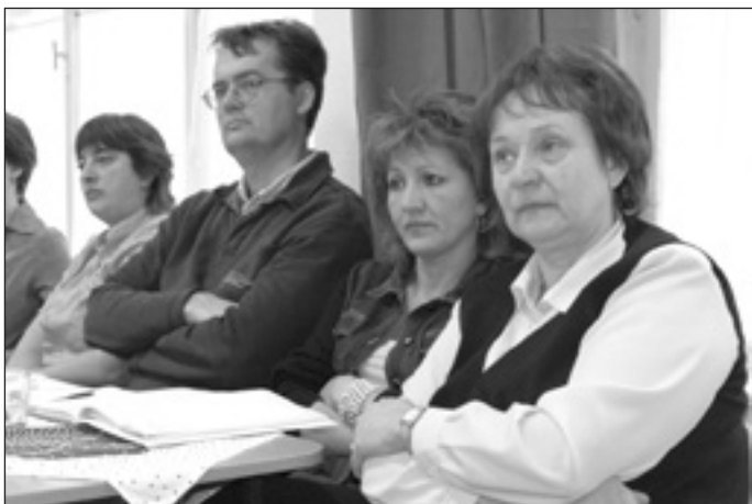
A projektindító nap a Klapka György Általános Iskolában

A 2000-ben elvégzett kompetencia alapú PISA-mérés eredményei világítottak rá először arra, hogy a 15 éves korosztály mint-