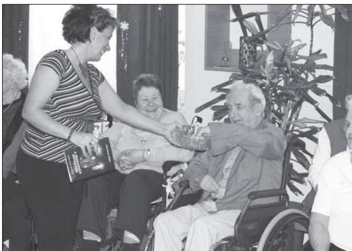
Ki lesz a tombola következő nyertese?