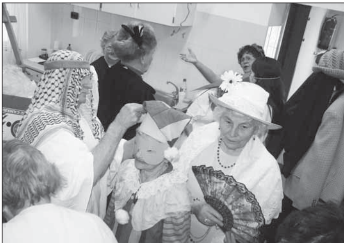
A jelmezek igazítása