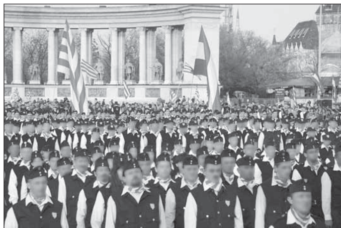
Budapest, XXI. század