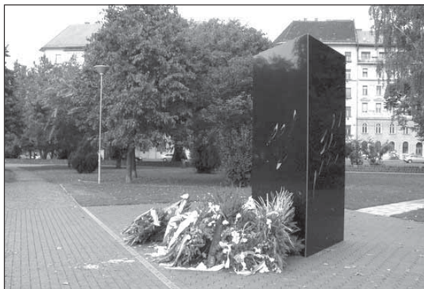
Cigány holokauszt emlékmű, Budapest

Július 22. – Befejeződik a megsemmisítő tábor építése Treblinkában. Tíz gázkamrában (mindegyikben 200 embert) gyilkolják meg szénmonoxiddal (később Zyklon-B-vel) az áldozatokat. A holttesteket nyitott gödrökben égetik el.