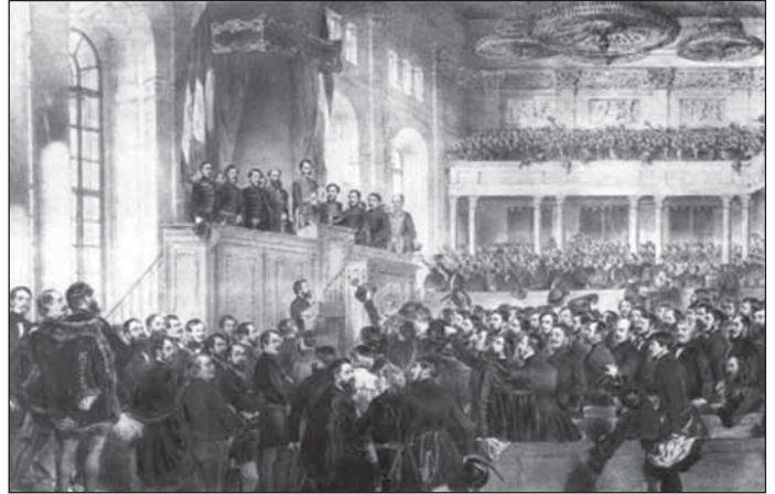
Az első magyar parlament megnyitása, 1848.

„Vajon csak egy-e a jog, vagy többféle? A jog csak egy, mit a természet adott. Hanem ahol a tiszta igazság nem uralkodik, az erősebbek a gyöngébbeknek természeti jogait számtalan módon korlátozzák, s aztán ezen korlátozás fokozatai szerint nevezgetik el a jogokat.”