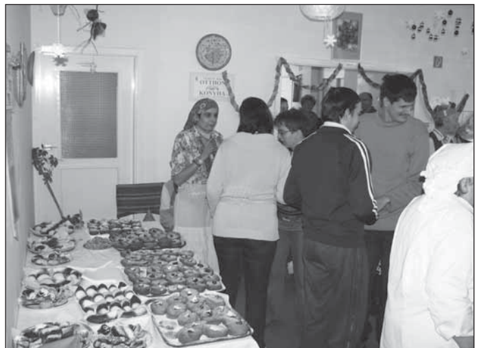
A farsangi fánknak is sikere volt

A komoly férfiak közül mindjárt kikerült Dobó István, Bornemissza Gergely, de testet öltött Cecey Éva és Jumurdzsák, a török is. Mások a mesevilágból vették az ötletet. Bóbe baba, Seherezádé, a Jóságos Favágo vagy az Éj Királya is meglevenedett.