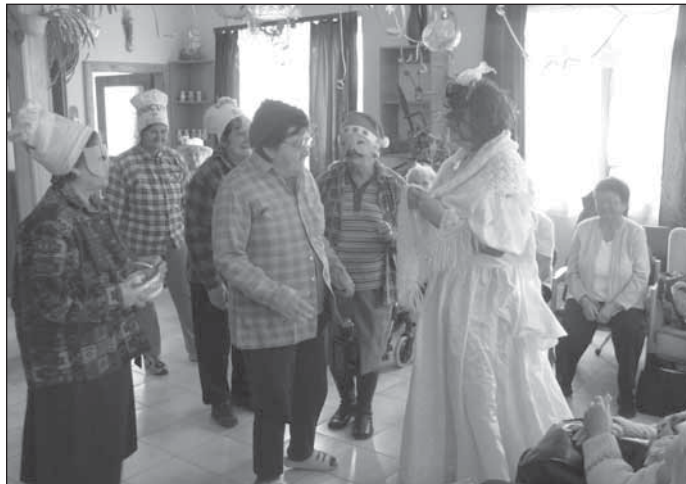
Hófehére és a hét törpe

24-én Valentin napot ünnepeltünk, ennek keretében beszélgettünk, majd az erre az alkalomra különösen díszített, nagyon ízletes süteménnyel kínálgattuk a jelenlévőket.