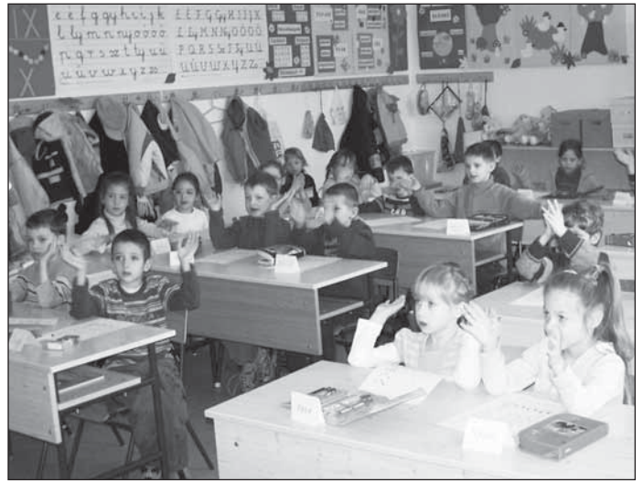
Ovisok az iskolapadban

Az Iskolanyitogató programnak iskolánkban több éves hagyománya van. A tapasztalatok azt mutatják, hogy az óvodákból jól felkészült, iskolára hangolt gyermekek érkeznek hozzánk. Köszönjük az óvó nénik felkészítő munkáját!