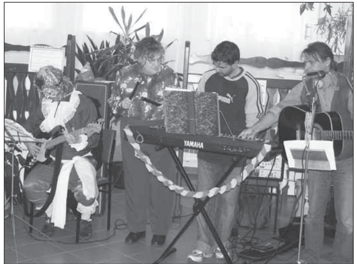
A Csipet-csapat zenés műsora

Az idősek egy csoportja valami különlegesre vágyott. Most olvastuk a foglalkozáson az „Egri csillagok” című regényrészletet – adjuk elő azt! Jaj, de izgalmas!