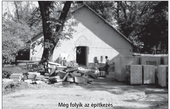
Még folyik az építkezés

A keresztény szellemben történő nevelés fontos része a mindennapos áhítat – amelyet az óvónő vezet. A gyermekek vallásos nevelése az életkoruknak megfelelő szinten történik. A gyermekek napirendjébe beilleszkednek a csendes percek, amikor a gyerekekkel imádkozunk, Jézus életéről és erkölcsi kérdésekről beszélgetünk. Éttek előtt és után imádkoznak. A nagyobb egyházi