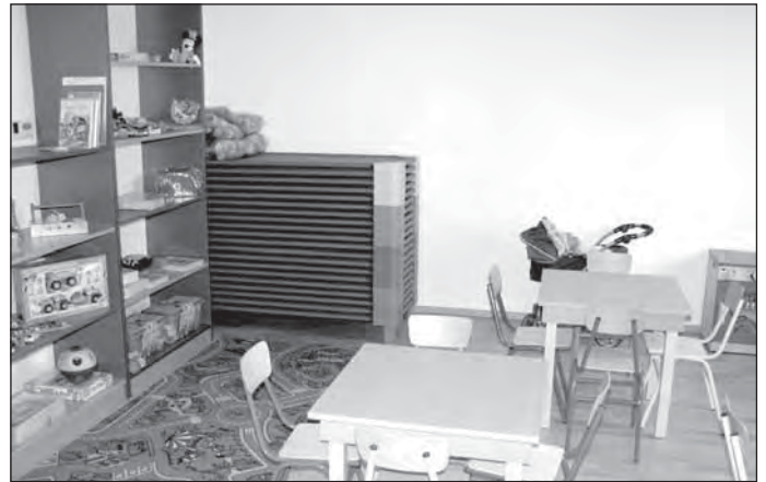
Még üres a csoportszoba

– Az alapítványi hozzájárulás összege 55 ezer forint havonta. Az étkezésért külön kell fizetni, ennek térítési díja 8 ezer forint egy teljes hónapra. Akik csak fél napot töltenek az intézményben, azoknak 6 ezer forintot kell fizetni. Az alapítványi hozzájárulás összege ugyanaz, akár egész, akár fél napot tölt a gyermek az intézményben.