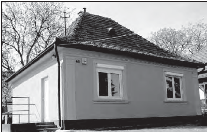
Az óvoda az Isaszegi úton

– Szeretnénk a szükséges dolgokon túl sok pluszt nyújtani. Arra törekszünk, hogy családiás légkörben nagyobb odafigyelést kapjanak a gyerekek intézményünkben. A kicsi létszám mindenképp előnyös a gyerekeknek, akikkel 4 felnőtt foglalkozik majd. Kettő óvodapedagógus és két dajka. Szükség szerint szakembereket (logopédus, pszichológus, gyógynevelő stb.) is foglalkoztatni kívánunk.