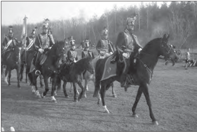
Az isaszegi csatabemutató

Volt mire építenünk: immár két évtizede a Tavaszi Hadjárat keretében korhű öltözékben újrátjátszák a szabadságharc legfényesebb ütközetét, az isaszegi csatát, ehhez számos kiegészítő rendezvény kapcsolódik. Összekötve tehát a Történelmi Napok eseményeivel, vállalkozói tanácskozást szerveztünk a határon túliakkal való gazdasági együttműködés élénkítésére, az onnan meghívott festők, szobrászok alkotásaiból képzőművészeti , egy helyi fényképező műveiből pedig fotókiállítás nyílt. A szlovák kisebbségi önkormányzat emlékkápolnát avatott ez alkalomból. A testvértelepülési kapcsolatok mellett, az isaszegi reformátusok kiépítették a partnerséget a csúzai gyülekezettel , így családknál láttuk vendégül az ottani presbitereket, templomunkban a csúzai lelkipásztor hirdetett ígét, egy eszéki egyetemi tanár pedig a Drávaszög egyház- és művelődéstörténeti emlékeiről tartott vetítettképes előadást.