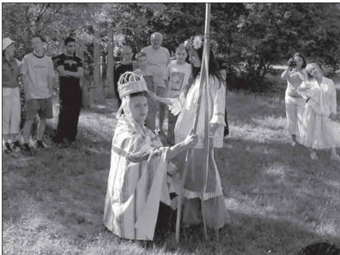
Pünkösdi király megkoronázása

Amolyan legényvirtus volt, lovas versennyel, tűzgrással, tekézzel. Aki a legderekabbnak bizonyult, egy évig ingyen ihatott a falu kontójára és minden mulatságra, lagziba hivatalos volt. A legények engedelmeskedni tartoztak neki. Uralma egy évig tartott.