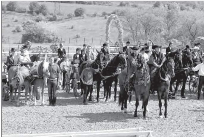
A megnyitó díszvendégei

A kisgyermeket állatsimogatóval várták, ahol barikkal, malacokkal, mini pónikkal találkozhattunk. Szabadon be lehetett menni az istállóba, és még lovakat is etethettünk szalmával. Traktorokat nézegethettünk, olyanokat, amelyekkel mindennap nem találkozunk már az utcákon. A gyermekek, köztük az én kisfiam is ezt élvezte a legjobban.