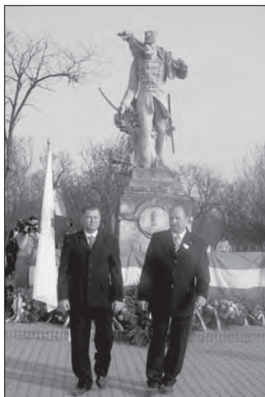
Koszorúzás a Honvédsírnál