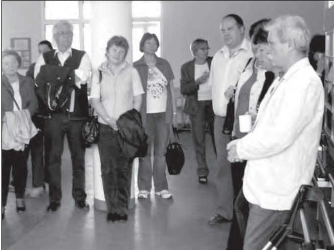
A kiállítás megnyitója

A világ eseményei valami miatt a média számára csak akkor érdekes, ha valami mocskos, vagy dráma lengi körül. De történnek jó és tisztességes dolgok is! Vannak emberek, akik komolyan veszik és teszik a feladatukat, a mi örömünkre és boldogulásunkra.