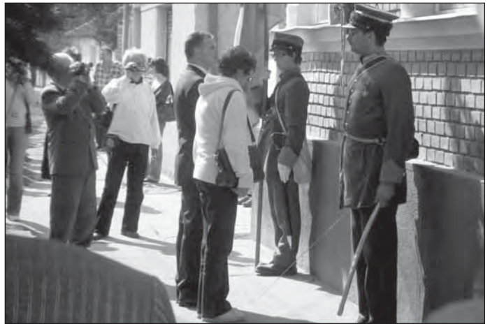
A lengyel légió emléktáblájának koszorúzása

Szlovákia egyik legdinamikusabban fejlődő ipari parkja. Szintén családknál fogadtuk a Bojanóvban lezajlott „Ki tud többet Magyarországról?” vetélkedő győztes gyermekeit, Isaszegen pedig megrendezésre került a „ Ki tud többet Lengyelországról? ” című hasonló vetélkedő a 6-7-8. osztályosok számára.