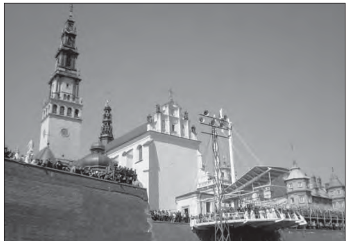
A Bazilika és a szabadtéri oltár

Hétfő reggel indultunk haza. Voltak, akik siettek, ők a legrövidebb úton hazajöttek. A többiek – köztük én is – Krakkó felé vettük az irányt. Délelőtt megtekintettük a belvárost, és csak ezután indultunk haza. Más útvonalon mentünk, mint ahogy jöttünk: Krakkó – Zakopane – Poprad – Liptószentmiklós – Rózsahegy – Besztercebánya – Ipolyság – Budapest. Az út így hazafelé hosszabb volt, fárasztóbb is, de megérte átkelni a Tátrán. Gyönyörű vidék. A társaság utoljára a magyar határ átlépése után állt meg. Itt hálát adtunk Istennek, hogy épségben hazaértünk, és elköszöntünk egymástól.