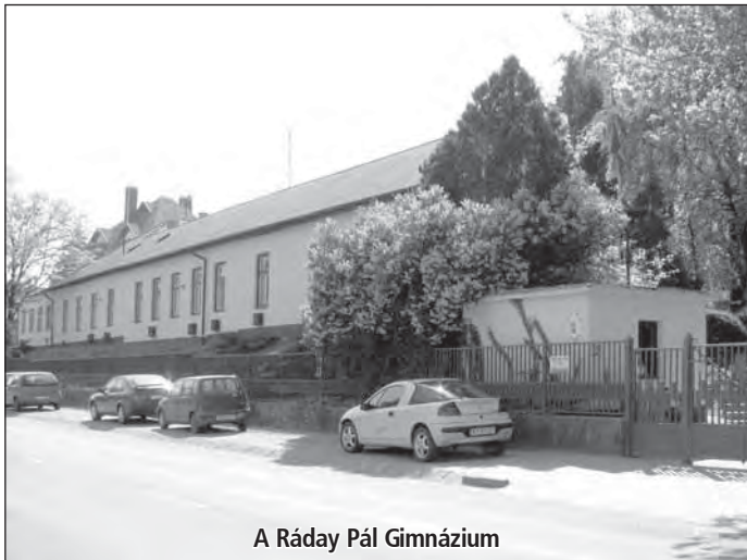
A Ráday Pál Gimnázium