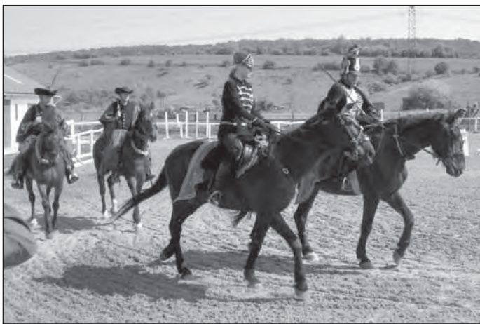
Huszárok és csikósok