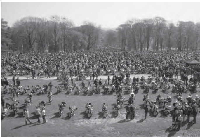
Gyülekeznek a motorosok

Az úticél a lengyelországi Czesztochowában található pálos kolostor volt. A kolostor a lengyel vallási és nemzeti szabadság szimbóluma. Itt található a világ egyik legismertebb Szűz Mária ábrázolása, a czesztochowai Fekete Madonna ikon. Az ikonnak csodatévő erőt tulajdonítanak, ami évszázadok óta vonzza a zarándokokat az egész világról. A hely a világ egyik leglátogatottabb zarándokhelye.