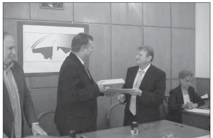
Kenyhec és Isaszeg polgármesterei aláírták a testvérvárosi megállapodást

a sport, a hitélet, a gazdaság, az idegenforgalom területére, ezek egy része az első pillanattól működik is a legtöbb irányban. Pedagógusok, gyermekek, önkormányzati dolgozók kölcsönös látogatására került sor, tánccsoportunk vendégszerepelt Lengyelországban, részt veszünk egymás jeles napjain, eseményein.