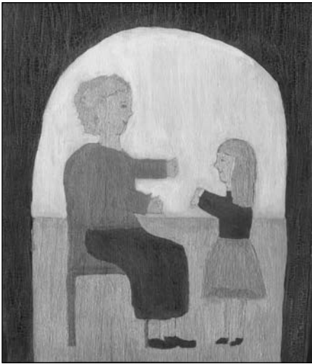
Péter Fruzsina munkája

haragudtam anyára, amiért engem nem vitt magával. A nagy azonban leült az ágy mellé. És mesélt. Tulajdonképpen akkor értettem meg, milyen fontos számomra az édesanyám, és hogy mennyire szeret en-