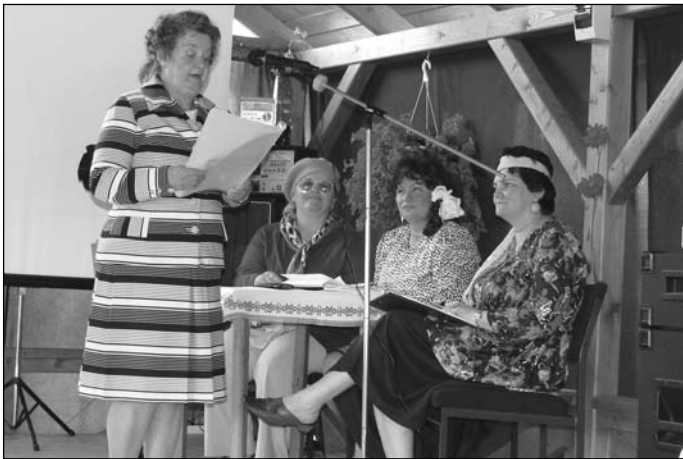
A „Kí mit tud” egyik szereplője és a zsűri

dennapjait mutatta be humoros formában. A közönség viharos tapsal jutalmazta a humoros „menüt”. Újabb tánc következett, a Pitti Katalin Idősek Klubjának tagjai fergeteges „kán-kánt” adtak elő. A szünni nem akaró tapsban az ismétlés kötelező volt.