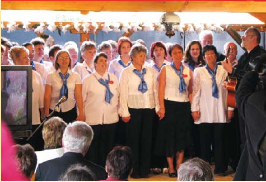
ESE dolgozóinak énekkara

A jubileumi ünnepség 2009. június 5-6-án került megrendezésre Pécelen