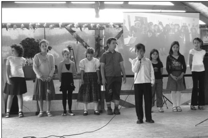
A Petőfi Sándor Általános Iskola alsós diákjai

Következett az ESE gyermekpályázatainak eredményhirdetése, az oklevelek és az ajándékok átadása.