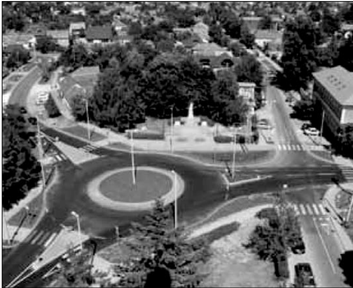
Az új átépített csomópont

Immár nemcsak a körvonala rajzolódik ki, hanem hihetetlen gyorsasággal megépült Isaszeg központjában az új körforgalmi csomópont, amivel egy régi elképzelés, vágy valósult meg. Ugyanakkor elkezdődött a főútvonal felújítása is, és Nagytarcsa felől Dány irányába a városhatárt jelző táblaig az ott található buszmegállók felújításával már el is készült.