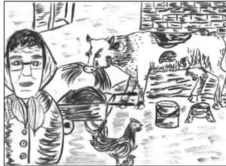
Majoros Beáta rajza

Képzőművészeti alkotások kategória helyezettei óvodás korcsoportban