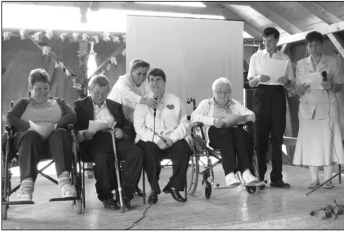
A Bacsoni István Rehabilitációs és Ápoló Otthon lakóinak és dolgozóinak előadása

dennapjait mutatta be humoros formában. A közönség viharos tapsal jutalmazta a humoros „menüt”. Újabb tánc következett, a Pitti Katalin Idősek Klubjának tagjai fergeteges „kán-kánt” adtak elő. A szünni nem akaró tapsban az ismétlés kötelező volt.