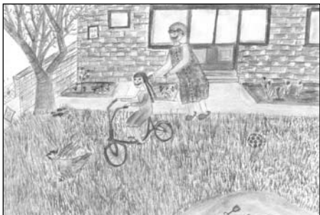
Sáros Rozália rajza