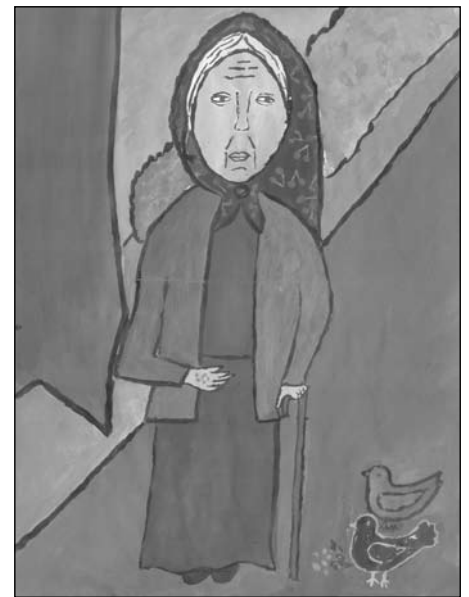
Bajusz Izabella munkája

Az a szerencsém, hogy közel lakik hozzánk. Ez nagyon jó, mert sok időt tölthetek vele.