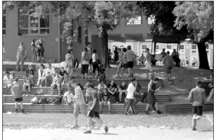
Drukkerek a lelátón

Délután a felnőttek voltak a főszerep. Képviselők és civilek