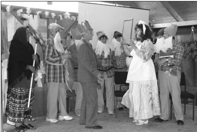
Hófehérke és a hét törpe

A munkatársak és gyermekeik által előadott „cigánytánc” sikerét bizonyította, hogy a nézők közül többen is bekapcsol-