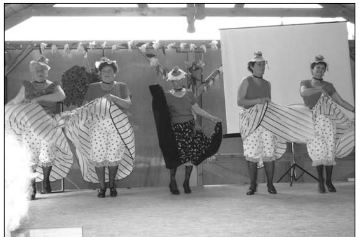
A Pitti Katalin Idősek Klubjának tagjai „Kán-kánt” adtak elő