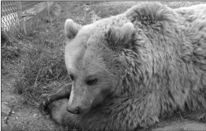
Hát... nem Micimackó...

Aki nem járt még ebben a városban, javasolom, figyelje a táblákat, amik kiválóan elnavigálják az utazót. A park bejáratától kb. 70 méterre van a parkoló, ahol az autót hagyhattuk, mindez 200 Ft-ba került, időhatár nélkül. A belépő ára 300 Ft/fő. Bár nincs korhatár, Pannáért mégsem kellett fizetni. A Medveotthon területére gyalog sétáltunk be, és a szép fakapu mögött már meg is láttuk az első hatalmas barnamedvét.