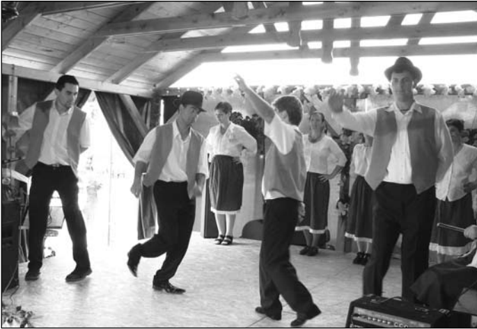
A Lakóotthonosok tánca