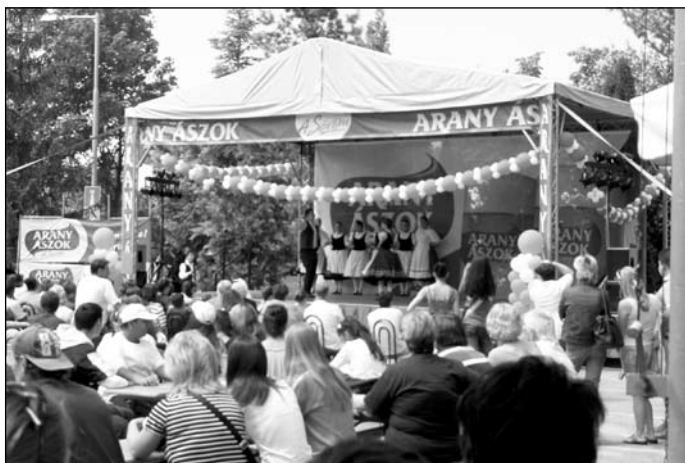
Pillanatkép a táncfesztiválról