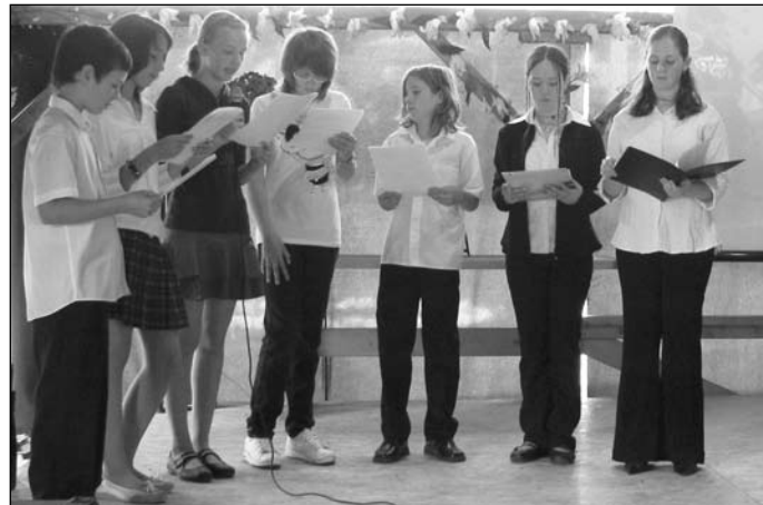
A Petőfi Sándor Általános Iskola felsős diákjai

Folytatódott a vidámság. A Baczoni István Rehabilitációs és Ápoló Otthon lakóinak „Humor-bonbonjai”-nak csattanói - bombaként robbanó nevetésre inspirálták a közönséget.