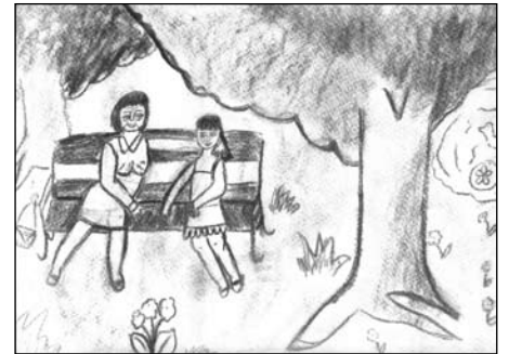
Hoffmann Delilla rajza