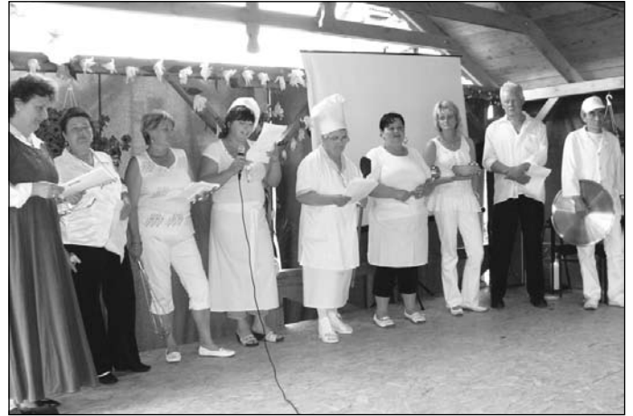
Az Otthon Konyha dolgozóinak előadása

A Keresztes és a Vitézek, majd a Beebor zenekarok koncertje a könnyűzene rajongóinak okoztak kellemes perceket. A külföldi vendégeinknek a zene és a tánc közvetítéséhez nem volt szükség tolmácsra.