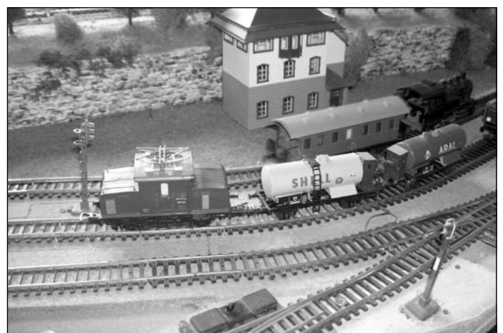
Az egyik kiállított terepasztal