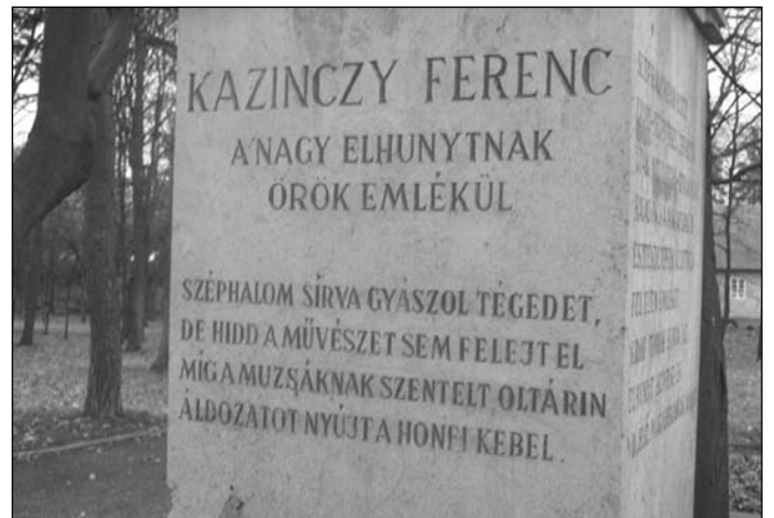
Kazinczy Ferenc síremléke

A fogságban készített jegyzeteit később kibővítette, de naplóját nem adták ki, csak 1848-ban közöltek belőle egy részt. Halálának 100. évfordulóján adták csak ki. Terjedelmes irodalmi levelezést