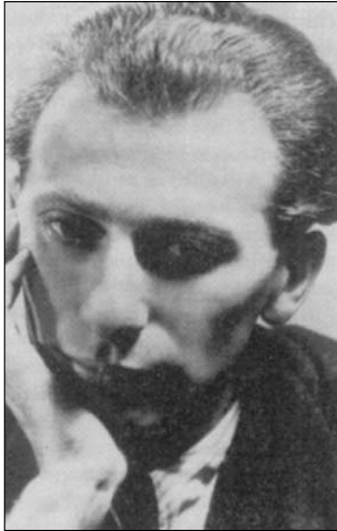
Radnóti Miklós (1909-1944)

Írtam, mit is tehetnék? A költő ír, a macska miákol és az eb vonít s a kis halacska ikrát ürít kacéran. Mindent megírok én, akár neked, hogy fönn is tudd hogy' élek én, mikor a robbanó és beomló házsorok között a véreles hold fénye támológ és feltüremlenek mind, rémülten a terek, a lélegzet megáll, az ég is érmelyeg s a gépek egyre jönnek, eltűnnek s újra mint a hörgő örület lecsapnak újra mind! Írok, mit is tehetnék. S egy vers milyen veszélyes, ha tudnád, egy sor is mily kényes és szeszélyes, mert bátorság ez is, lásd, a költő ír, a macska