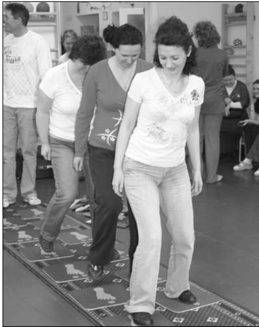
Pedagógusok próbálják ki az új eszközöket