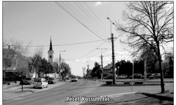
Pécel, Kossuth tér

A városközpont rehabilitációjára is nyújtottunk be pályázatot. Az első fordulón túl vagyunk, a második fordulóra sok-sok feladatot kell még elvégezni. A benyújtott pályázat összege valamivel egymilliárd forint felett volt. A megnyert összeg 500 millió forint, mivel a kiíró csökkentette a rendelkezésre álló forrásokat. A módosított összeg miatt az elvégezhető munkákat csökkentenünk kell. A Műemlékek Nemzeti Gondnokságával egyeztetünk, hisz velük konzorciumban valósítjuk meg a pályázatot. Problémát okoz még, hogy az összeg csökkenése mellett magasabb az önrész aránya is. Az önrész az eredeti 10-ről 26 százalékra emelkedett, ami azt jelenti, hogy plusz 30-40 millió forintot kell biztosítanunk.