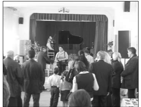
Érdeklődők a rendezvényen

A rendezvény egészében nagyon jó hangulatban telt. Mindenki megtalálta magának a megfelelő beszélgetőpartnert. Számomra sok újat mutatott ez az esemény, olyan emberekkel és művekkel ismerhettem meg, amelyekkel más körülmények között nem biztos, hogy találkoztam volna.