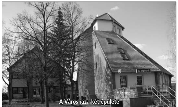
A Városháza két-épülete

Projekt tervezett befejezése: 2010.06.18.