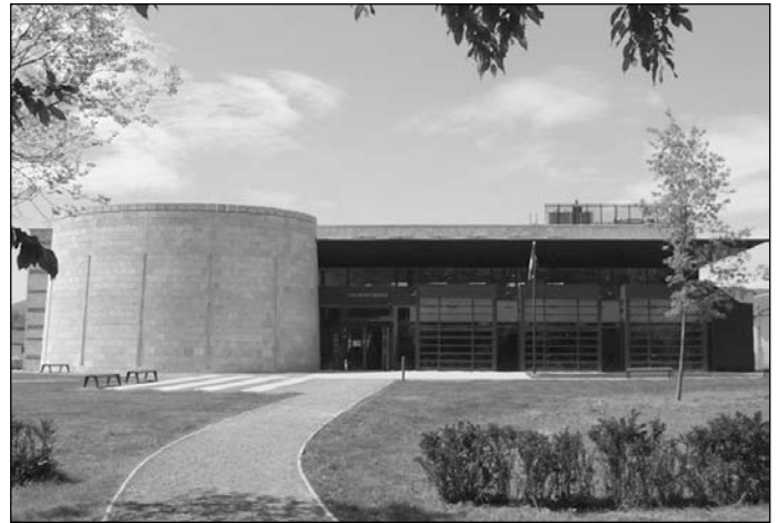
A Magyar Nyelv Múzeuma

Egy kortárs pesti könyvkereskedő sokkal később azt mesélte Kazinczynak, hogy Rádaytól körülbelül annyi pénzt vett be a szállított könyvekért, mint összes többi vásárlójától együtt. Ennek a könyvtárnak nemcsak nagy híre volt, de közhasznúvá is vált. Ráday bárkinek rendelkezésére bocsátotta, aki oda akart menni, hogy olvasson. És aki olvasás, tanulás céljából érkezett Pécelre, az addig lehetett Rádayék vendége, ameddig csak akarta. De amíg ott volt, olvasnia, tanulnia kellett.