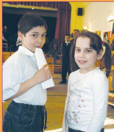
Érdeklődők a rendezvényen