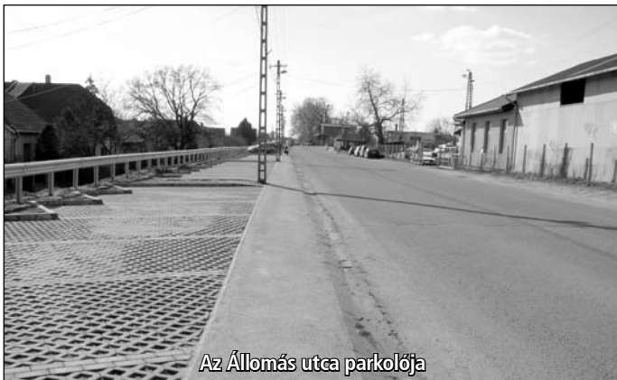
Az Állomás utca parkolója

Projekt tervezett befejezése: 2009.06.30.