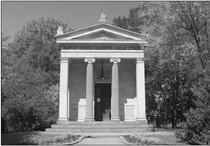
Kazinczy Ferenc mauzóleuma

1985. április 26-án a sátoraljaújhelyi városházán, az egykori