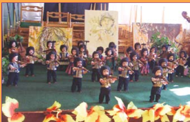
Ízelítő a kiállított alkotásokból

Beszámolóinkat a 10. oldalon olvashatják.