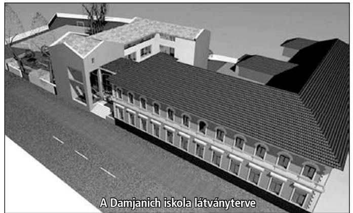
A Damjanich iskola látványterve

A Damjanich Iskolának lesz egy új épületszárnya, valamint a régi szárny felújítása is célunk. Jelenleg az iskola egy része a Templom ut-