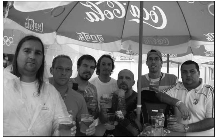
Sok ismeretség kötődött Pekingben

– Oroszországban újra aszfaltúton haladhattunk. Egy fél napos hóviharban volt részünk, az éjszakák hidegek voltak, és az állófűtésünk nem működött megfelelően. Megint szereltünk. Oroszországon gyorsan átrohantunk, napi 900 kilométert is megtettünk. Cseljabinszknál nézegettük a térképet, és úgy döntöttünk, Moszkva felé megyünk. Tranzit úton mentünk, ami kikerülte a városokat, így maradt 1 napunk Moszkvában nézelődésre. Jártunk a Vörös téren, megnéztünk egy katonai őrségváltást, jártunk szupermarketban. Persze nem vásároltunk, mert igen drága az orosz főváros.