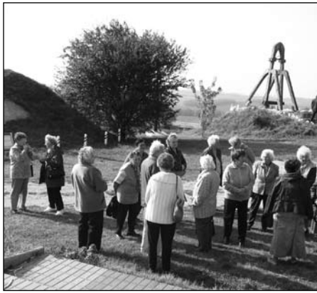
Séta az Emlékparkban

ből". Elsőként Montecassinóban jártunk, ahol Szent Benedek 529-ben alapított kolostort, ahova komoly szerzetesi életre vágyó társakat vett maga mellé. Ez a kolostor lett a későbbi bencések anyakolostora. Utunk a sziléziai Vajdaságba vezetett tovább. Több zarándokhelyen is jártunk, mint pl. Turza , Pszów , ahol míves stációk ékesítik a keresztutat. Czeszochova és Jasna Góra a Mária-kultusz legnagyobb zarándokközpontjai a világon. Ezekben a falvakban sajátos módon lehet megnézni a lengyel zarándoklás történelmét és szertartásos jellegét, meglátogatva fontos és érdekes helyeket. Swieta Anna a csend és az elmélkedés helye, a domonkos apácák világa. Az ő oltalmuk alatt van Szent Anna kisgótikus szobra. Itt található a barokk templom és a vele egybeépített kolostor. Ez mindig fontos pihenő és imádkozó helye az ide igyekvő zarándokoknak. Különös napokat él át Szent Anna városa minden évben augusztus 26. körül. Ekkor érkezik meg a nagy ünnepre a hívők tömege. Mstów a szerzetesi élet egyik legrégebbi