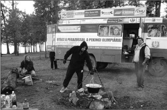
A „szálloda” és „konyhája”