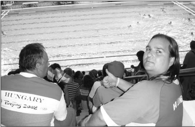
A vízilabdások egyik mérkőzésén

– A Gobi-sivatagban már több napja esett az eső, így nehezebben, csúszkálva, zötyögve haladtunk, és 3 nap alatt jutottunk Ulanbatorba. Odafelé 190 forintért kaptuk a gázolajat, visszafelé már majd 300-340 forintnyi lett az ára. Aztán ismét vízumbeszerzés következett. A várakozás idejét szereléssel töltöttük, sikerült megemelni a Roburt, és ennek nagy hasznát vettük később.