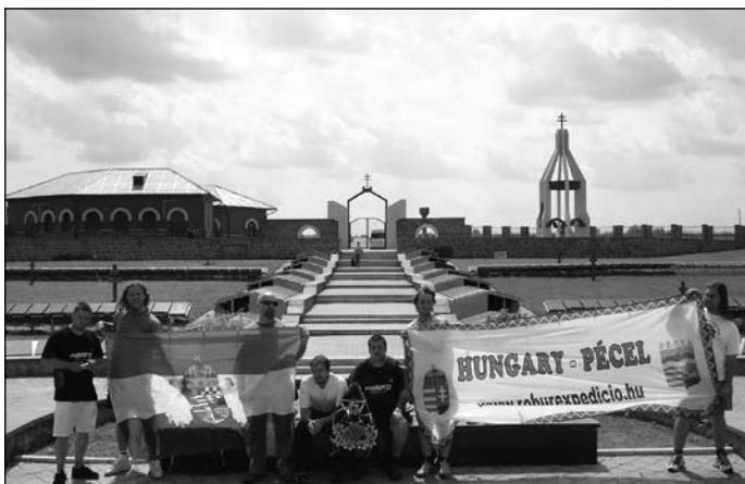
Rudkinoban, az emlékműnél

A várakozás ideje alatt szereltünk, mert néhány probléma már kijött menet közben. Nagy hasznát vettük a hatalmas szerszámos ládának és a tartalék alkatrészeknek.