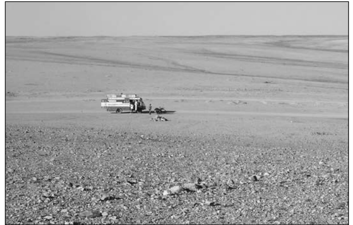
A sivatag tengerében