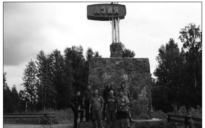
Európa és Ázsia közt

Aztán beléptünk Kazahsztánba. A fővárosa, Asztana nagyon gazdag, mesterségesen felépített, vadonatúj város. Minden csillog, ragyog. Amikor odaértünk, akkor ünnepelték fővárossá válásuk 10. évfordulóját. Rengeteg tartaléka van az országnak, biztosan nagyot fognak fejlődni. Amikor júliusban odaértünk, még nem volt ott nagykövetség. Az előző fővárosuk Alma-Ata volt, ezért tartott kicsit hosszabb ideig az újabb orosz tranzit vízum beszerzése. Egy hétre került. Ott már kaptuk a rossz hírt, valószínűleg nem tudunk majd a Roburral bejutni Kínába.