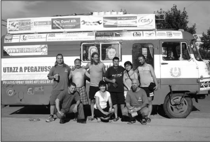
Közös fényképezkedés útközben

Osztrák dzsipesekkel találkoztunk útközben, ők említették, nem csak egy határátkelő van Mongólia és Oroszország között, van a kazah-mongol csücsökben, az Altáj-hegységben egy másik (bár arra nem vezet aszfaltút). Ez szöveget ütött a fejünkben, és a visszaúti terveit kicsit megváltoztatta.