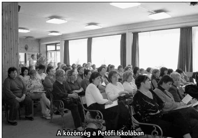
A közönség a Petőfi Iskolában