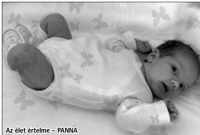
Az élet értelme – PANNA

A nemzetközi gyermeknap a világ több országában megtartott ünnep. 1950 óta május utolsó vasárnapján ünnepeljük, a Nemzetközi