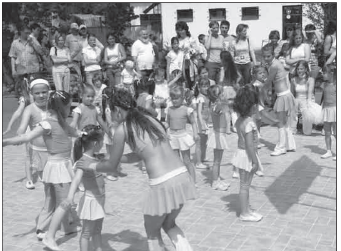
A kisebbek kis segítséggel kezdték el produkciójukat