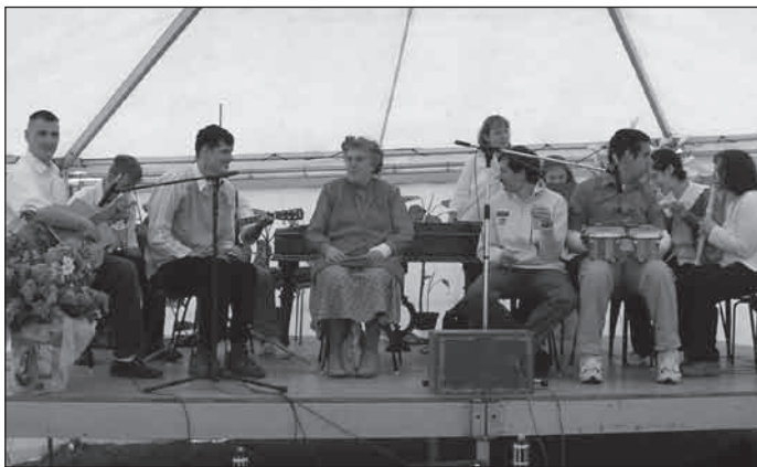
2007. az ESE Csipet csapat zenekara