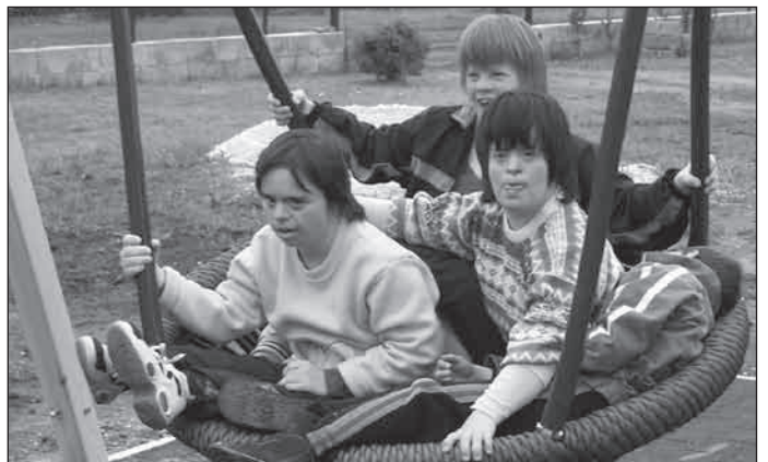
2007. Isaszeg, fogyatékosok játszótéren