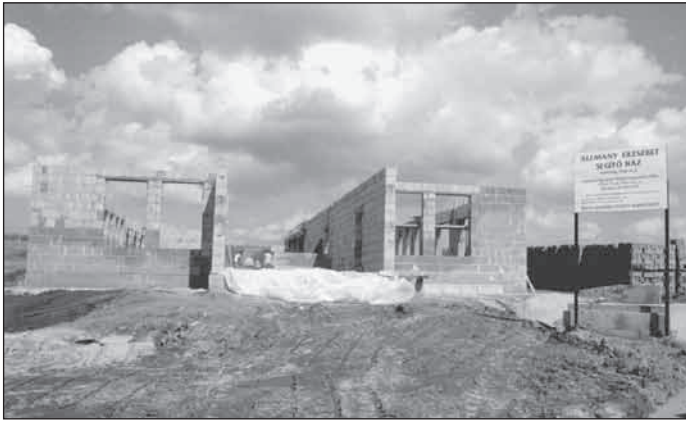
2001. szeptember, Isaszeg