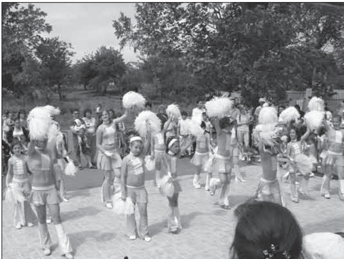
A lányok tánca szép volt és látványos