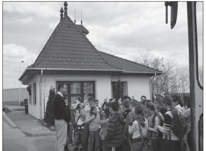
Vácszentlászlón a Szelektív Hulladékhasznosító és Környezetvédelmi Kft. telephelyén.