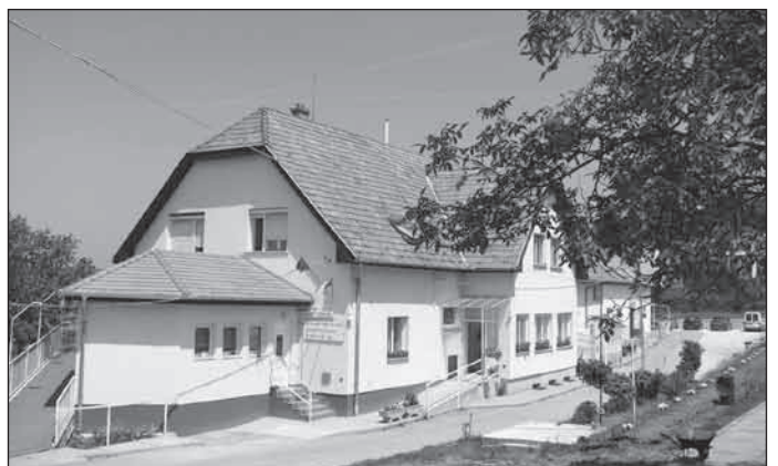
Tessék befáradni! ESE 2008. Pécel