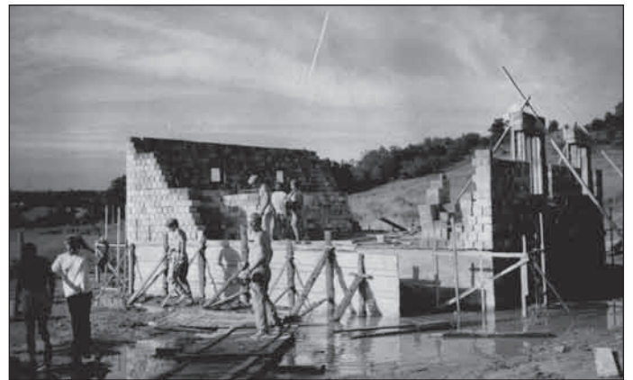
1991. június, holland építőtábor