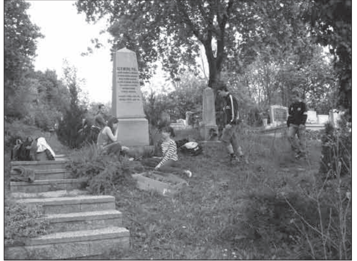
A Szemere sír gondozása