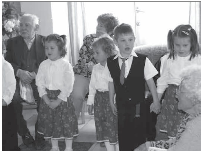
A Harangvirág Óvoda kicsinyei

Május 6-án a Harangvirág Óvoda kicsinyei anyák napi műsorral kedveskedtek. Mosolyaikkal, daloscskáikkal mindannyiunkat elbűvöltek, ajándékaikkal meghatottak. Köszönjük a pedagógusoknak a felkészítést, a gyerekeknek az előadást, és hogy eljöttek. Isten áldása legyen rajtuk, mindenkor örömmel várjuk Öket!