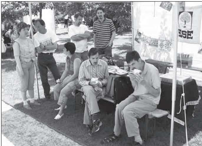
Az ESE-csapat az ESE sátorban