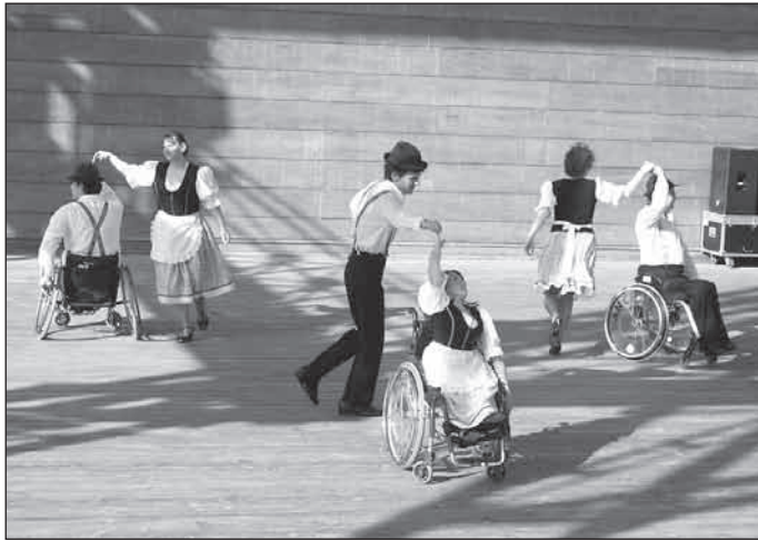
Táncosok a színpadon