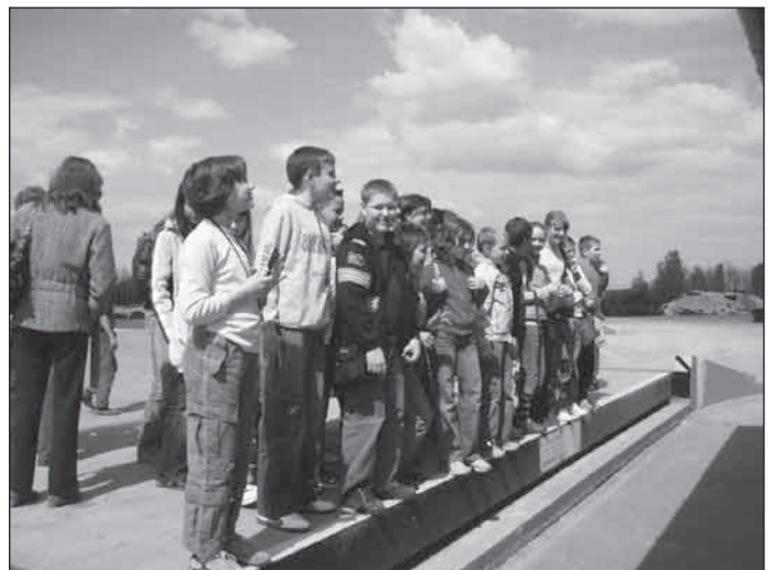
Itt mindent kilóra mérnek