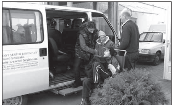
2007. Isaszeg, Támogató Szolgálatunk