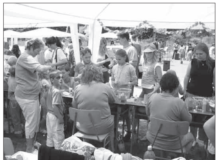
A gyerekek sokféle kézműves tevékenység közül választhattak