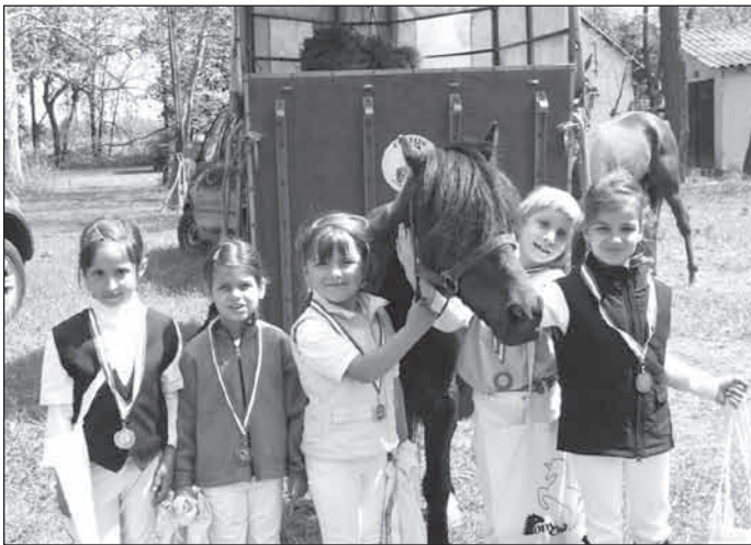
A versenyen résztvevő csapattagok

A versenyen 300 feletti startot regisztráltak, ez egy minősítő versenyen soknak mondható, így nehéz dolguk volt a gyerekeknek. Elsőként a kisebbek kerültek sorra, és a népes mezőny ellenére a sok gyakorlás eredményeképpen a dobogós helyek sem maradtak el.