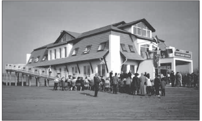
2002. március 15., I. épület avatása Isaszegen