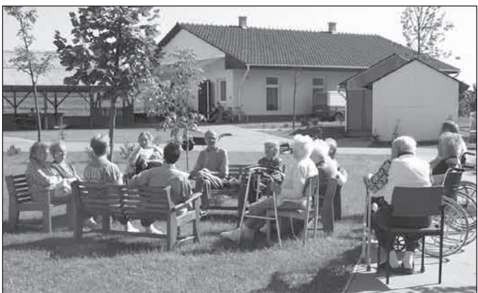
2007. piknik az isaszegi kertben