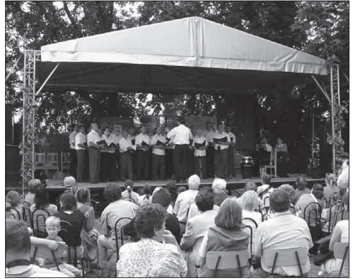
Petőfi Sándor Férfikórus

Szó volt a bor jó és rossz tulajdonságairól, hatásairól, őszintén, tudományosan és hétköznapiasan. Ez a legalább öt évezredes ital sok öröm és bánat forrása volt már. A Biblia is ír a borivás veszélyeiről, de annak gyógyító erejéről is, hisz mértékkel fogyasztva orvosság, még Pál apostol szerint is.