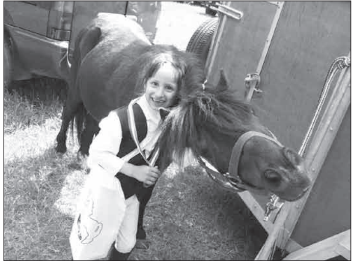
Együtt örül a ló és lovasa

A gyermekek sikereiből és kudarcaikból adódóan plusz élményekhez juthatnak, amelyek továbbviszik őket útjaikon a kitűzött cél felé, s amely tapasztalatok segítségükre lehetnek majd az életben is. Jelenleg a Gyermekek és Pónilovasok Országos Szövetsége által megszervezett Akadémia Kupára, a Biotop Gyermekek Ügyességi Versenyre készül a csapat.