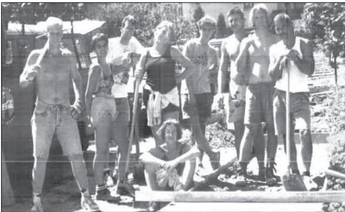
1993. holland építőtábor, Pécel