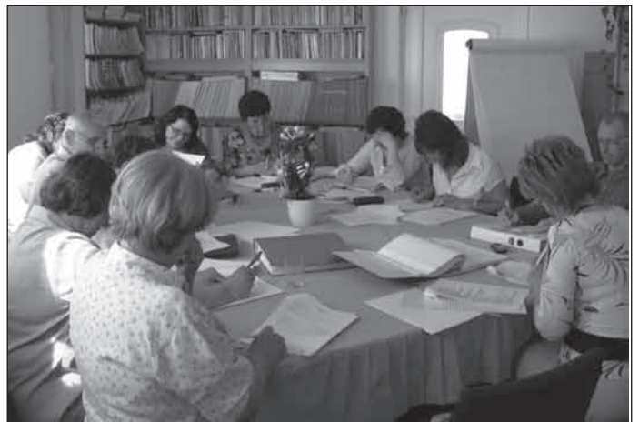
Mindenki koncentrált a dolgozatírás alatt

A vizsgát követően pozitív visszajelzéseket kaptunk a hallgatóktól arról, hogy olyan információkat szereztek, amelyet nemcsak az életben, hanem több munkaterületen is tudnak hasznosítani. A képzés emellett nemcsak ismeretekkel gazdagította a résztvevőket, hanem alaposan megismerhették egymás szervezeteinek misszióját, tevékenységét. Reméljük, hogy a jövőben ez az ismeretség gyümölcsöző partneri kapcsolatok alapja is lesz.