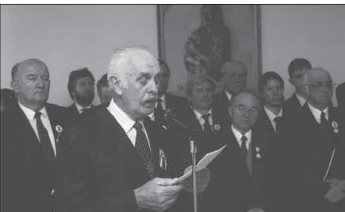
1998. március 15., Pécel épületavató ünnepség