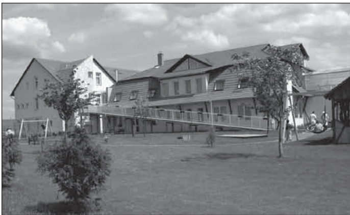
2003. augusztus, Isaszeg