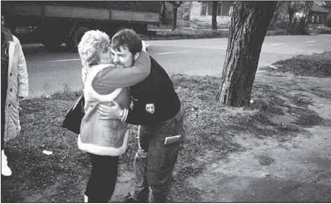
1989. október, a jössgrundi kapcsolat