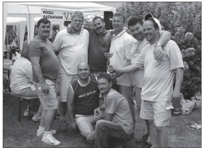
A főzőverseny győztes csapata