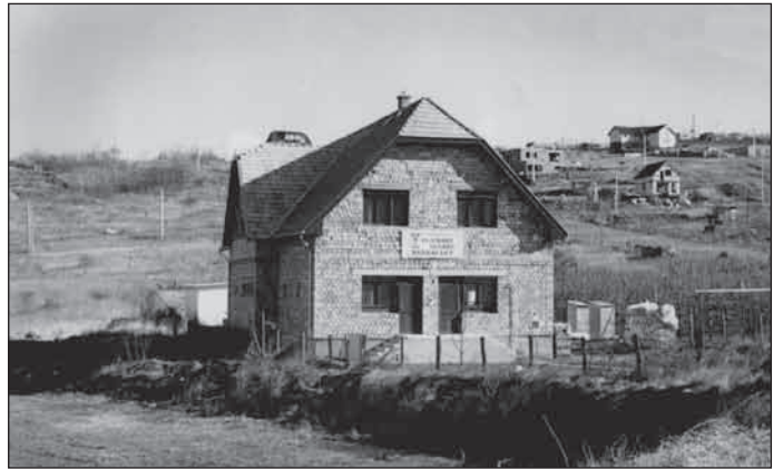
1994. október, Pécel