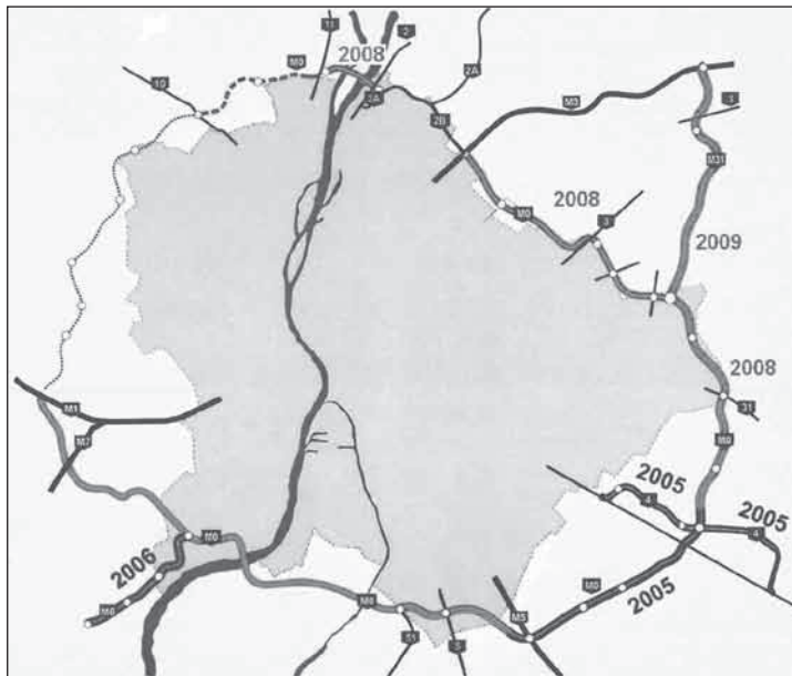
M0 áttekintő térképe

Jelenleg a keleti és az északi szektorban folynak építési munkák. Az északiban az északi Duna-híd (Megyeri híd) épül, a keletiben pedig a 4-es út és az M3 között építik az utat. A keleti szektor – ugyanúgy, mint a többi már meglévő szakaszok – kétszer két sávós autótút lesz. A Nemzeti Infrastruktúra Fejlesztő Zrt. a honlapján így fogalmaz: „2x3 forgalmi sávós autópályává fejleszthető 2x2 forgalmi sávós