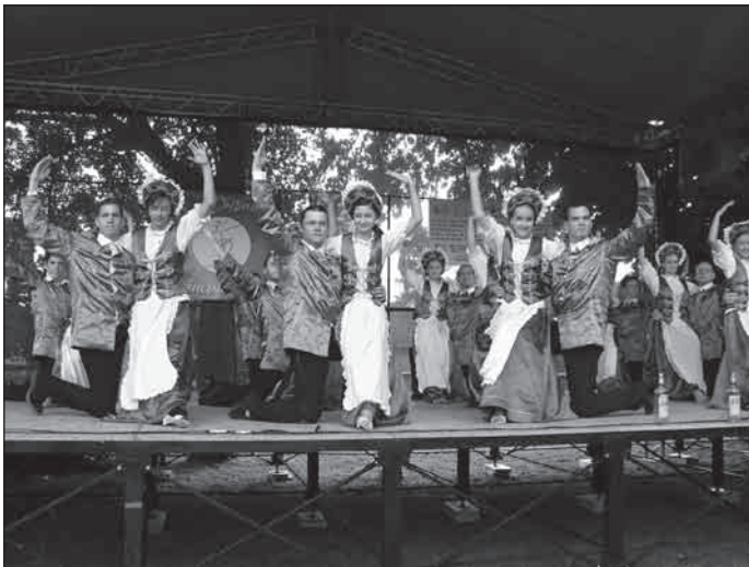
A DuDance Tánciskola tanulói

Eljött tehát a nagy nap, május 17. majd 18. A szervezők hálásak lehettek az égieknek, mert bár a két nap alatt többször lógott az eső lába, de talán onnan fentről látva a sok lelkes szervezőt és résztvevőt, inkább Pesten adta ki „mégét”, többek között elverve, a könnyű drogok legalizációja mellett tüntetőket.