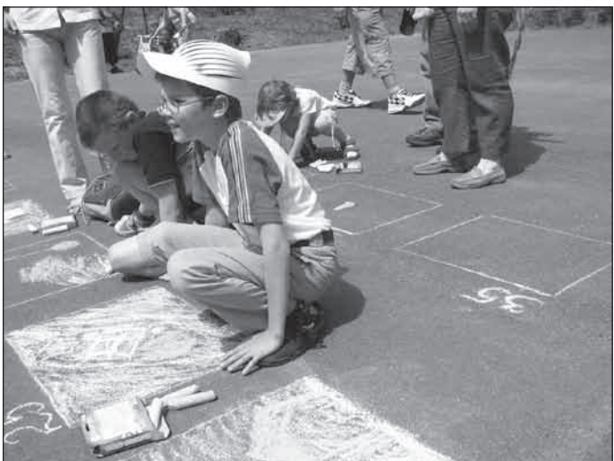
Rajzok és rajzolóik