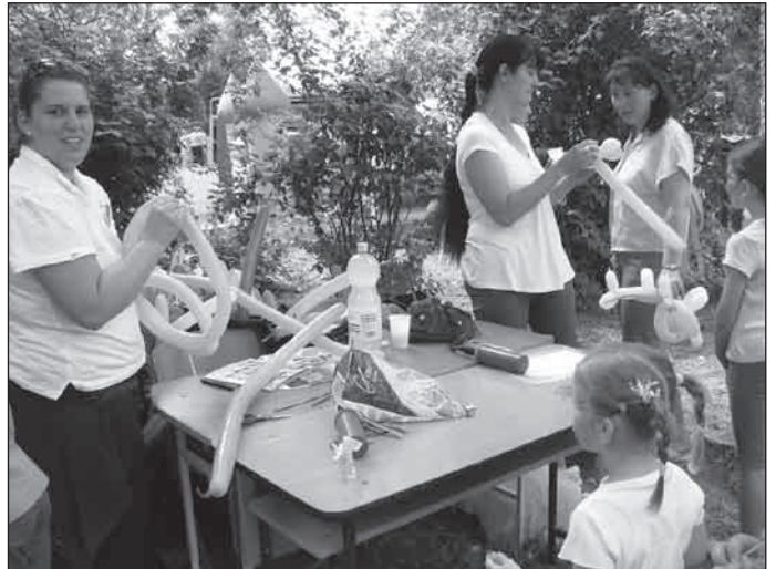
Lufiból készül a virág, a cica és még sok más