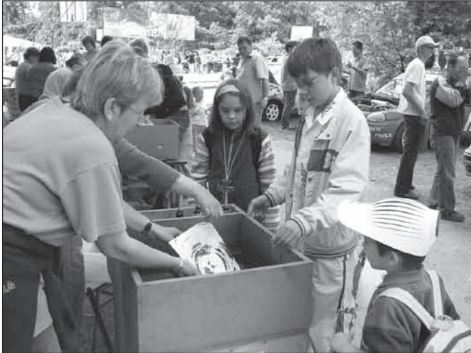
Gyönyörű képek készültek különleges technikával