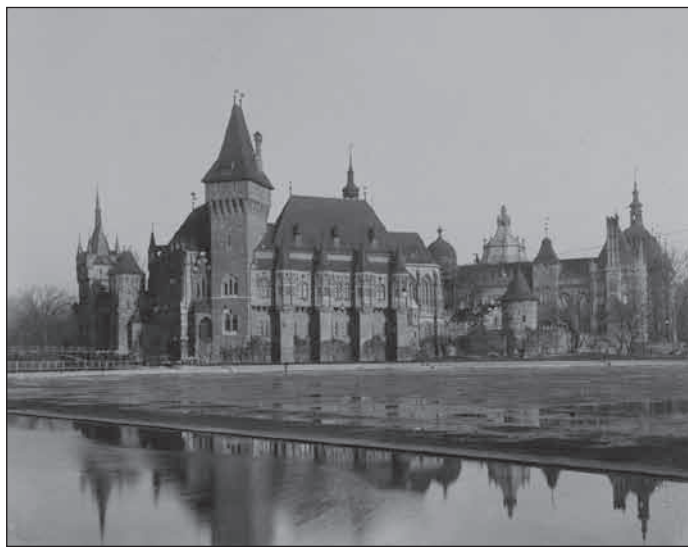
Vajdahunyadvár régi fotón

A parkból, a millenniumi ünnepségsorozat keretében hasították ki a mai Hősök tere területét. A Liget növényzete éppúgy tartalmaz famatuzsálemeket, mint nemrég ültetett fákat. Színfoltot jelentenek a