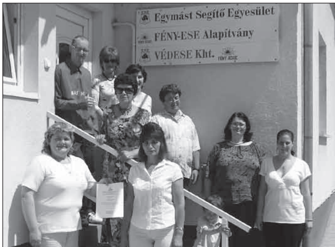
Néhányan a csapat tagjaiból

Április 30-án tartotta meg „A szolgáltatások kommunikációja” című előadását meghívott előadónk, Galánfi Csaba kommunikációs szakértő, aki a Magyar Női Karrierfejlesztési Szövetség tagja, valamint a Pécsi Tudományegyetem tanára. Számos profitorientált és nonprofit szervezet tevékenységében is részt vett, ezen kívül a MOL Rt. stratégiai kommunikációs és kutatási igazgatója volt. A képzés nagyon érdekesnek bizonyult, a civil résztvevők példáján keresztül vezetett végig a gondolatmenet. Az előadáson a szolgáltatások kultúráját, marketingjét és külső-belső kommunikációját ismerhettük meg. A jelenlévők hasznosnak tartották az elhangzottakat, és felettébb sok kérdés hangzott el az előadás témájával kapcsolatosan.