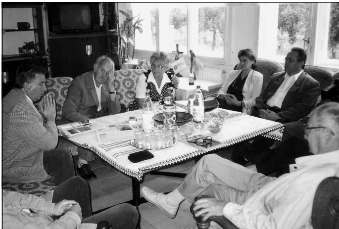
„Iskolát kell építeni!” fórum, ESE 2000.