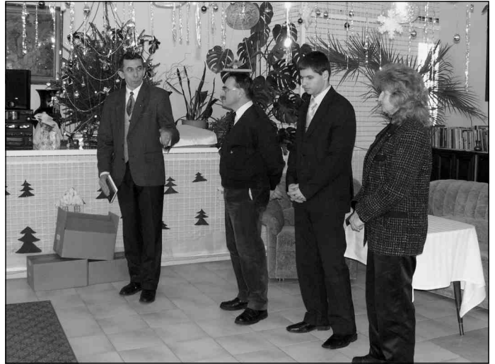
Karácsonyi ünnepségünkön a Gedeon Társaság tagjai

Hasonló élményeken kívül lehetőség van ingyenes vérnyomás- és vércukorszint-mérésre, a VÉDESE Kht. rehabilitációs rendelője fizioterápiás szolgáltatásainak igénybevételére.