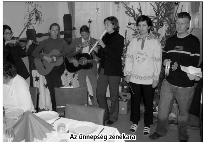
Az ünnepség zenekara

Végül pedig egy ízletes vacsora és kötetlen beszélgetés zárta az ünneplést.