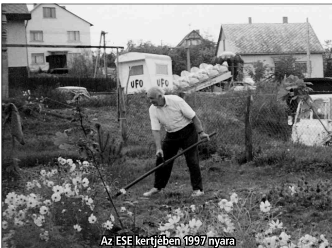
Az ESE kertjében 1997 nyara

Téged városunk emlékezete úgy tart számon, mint építő embert.