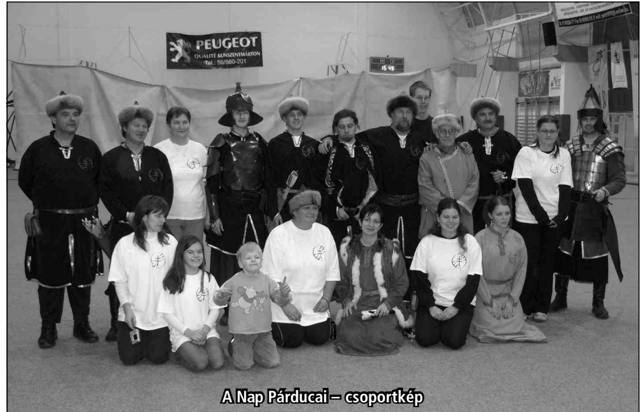
A Nap Párducai – csoportkép

tunk a Mikulás-kupán. Majdnem a teljes csapat ott volt beöltözve. Akinek még nincs meg a csapat ünneplő ruhája, pólóban volt, amin ott van a Nap Párduc jelvény. Büszkén viseljük, ezzel is kife-