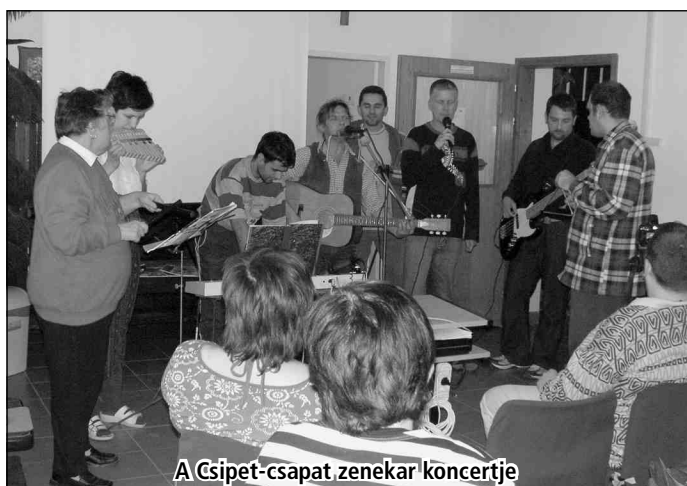
A Csipet-csapat zenekar koncertje

zók, takarítók – szerepe, hiszen a színvonalas és kellemes oktatási környezetet ők biztosították az elmúlt hónapokban.