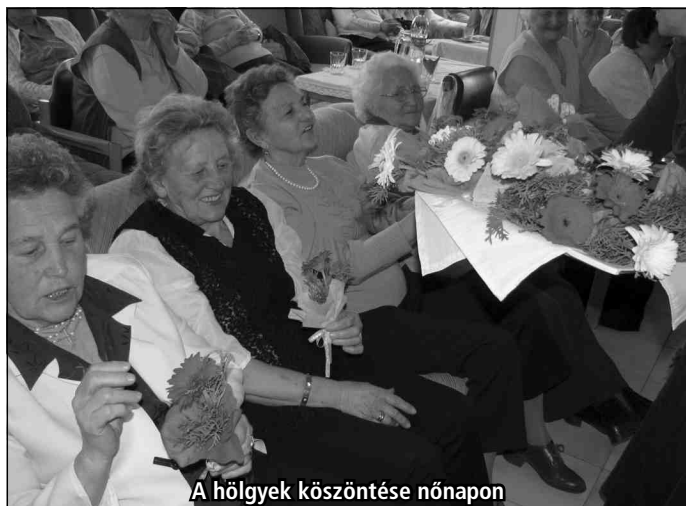
A hölgyek köszöntése nőnapon