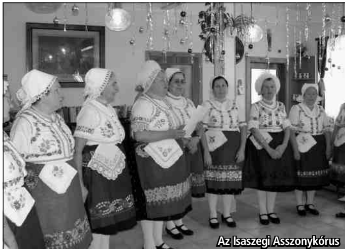
Az Isaszegi Asszonykórus

Intézményünk különféle ünnepein szerepelt már az Isaszegi Asszonykórus . Január 30-án klubunkba is meghívtuk őket, és együtt emlékeztünk a magyar kultúra napjára. Gazdagon díszített népviseletükben érkeztek, rövid bemutatkozásukban elmondták, hogy 1972 óta énekelnek együtt, és hogy többszörös országos minősítéssel büszkélkedhetnek. Hazánk legszebb dalaiból, illetve erdélyi vendégszereplésük során tanult ottani népdalokból állított