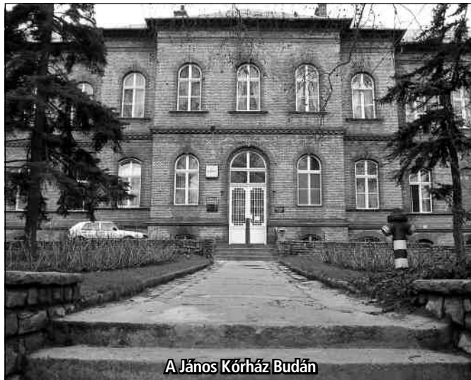
A János Kórház Budán