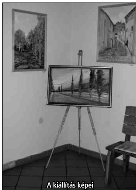
A kiállítás képei