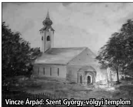
Vincze Árpád: Szent György-völgyi templom

Sok készülődést igényelt, míg kiválogattuk a megfelelő képeket, és amíg minden kép a helyére került. Annak ellenére, hogy már mindegyikünknek volt kiállítása, nagyon izgultunk, hogy minden jól sikerüljön, s hogy képeink elnyerjék a vendégek tetszését. Végül eljött a megnyitó. 18 óra után nem sokkal már tele volt a Kastély Vendéglő, ami örömmel töltött el minket, de fokozta az izgalmunkat is, mivel a megnyi-