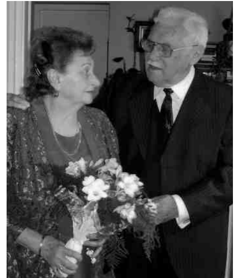
Feleségével házassági évfordulójukon

Arca fölragyog, amikor arról beszél, hogy