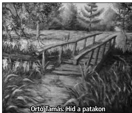
Ortó Tamás: Híd a patakon

Érdekes, hogy minden embernek más volt a véleménye egy-egy képpel kapcsolatban, és hogy mennyiféle gondolat jutott eszükbe az alkotásokat szemlélve. Sokakkal beszélgettünk, és az derült ki ezekből a beszélgetésekből, hogy az emberek vágnak a színekre, a fantáziadús képekre,