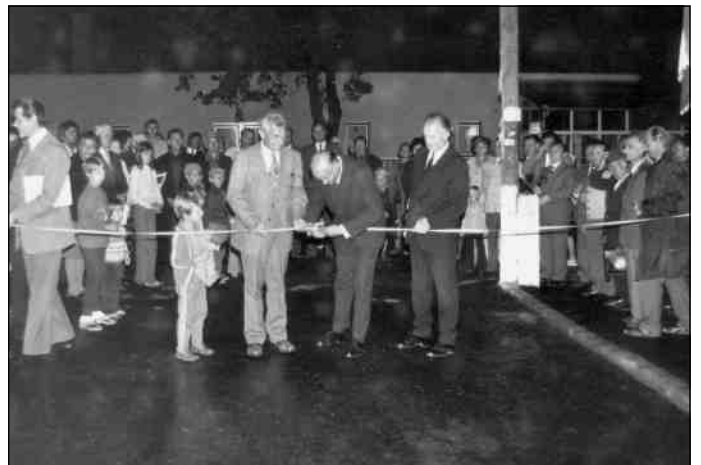
A Thököly utca ünnepélyes avatása (1976. szeptember 11.)