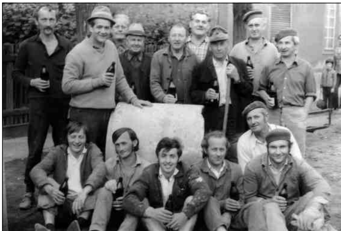
Az aszfaltozó brigád (1975 június)