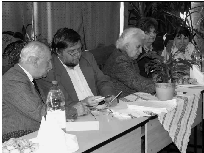
Dolgozik a zsűri

A vetélkedő helyszínén lezajlott részében inkább játékos, ügyességet és leleményességet igénylő feladatokban bizonyították a csapatok helyismeretüket és képességeiket. Először csatakiáltást kellett alkotni, amelyben benne volt a város, az iskola és a csapat megnevezése. A gyerekek ügyes kis rigmusokat találtak ki. Egy másik feladatban személyi címet kellett rajzolni Pécel jeles személyei számára: Ráday Pál, Ráday Gedeon, Karsai Zsigmond, Lázár Ervin és Fésűs Károly számára. Az igazán jó ötletek itt mutatkoztak meg. Láthattuk Lázár Ervin jellegzetes bajuszát, pipáját és mesefiguráit; Zsiga bácsi festőeszközeit és az erdélyi tájat; a Rádayak lakóhelyét, könyveit és írótlólat. Harmadik feladatként egy puzzle-szerűen kirakandó képet kellett megszerkesz-