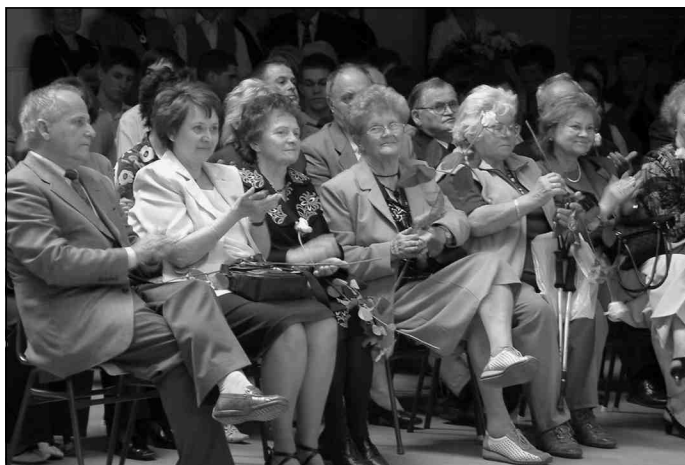
Az ünneplő közönség

A több mint tízezer lakosú nagyközség szinte minden lakosa az elmúlt tíz évben kapcsolatba került az iskolával valamilyen formában (diák, szülő, sportrendezvények, vetélkedők, kiállít-