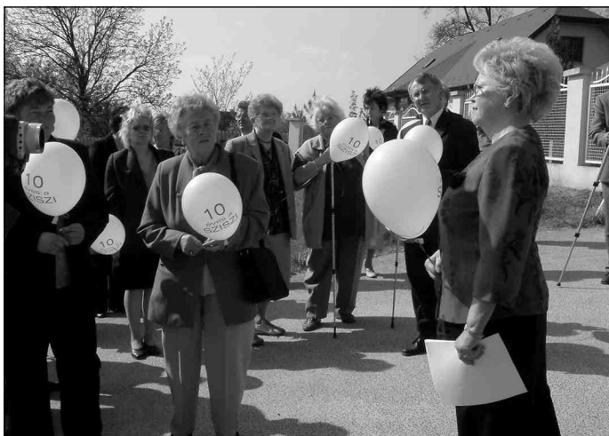
A park avatása

fotópályázat, valamint az ország-világ járás játék helyezetteit. Ugyancsak köszöntötte és ünnepelte az igazgatónő és az iskola diákjai, tantestülete a különféle országos versenyeken résztvevő és kimagasló eredményeket elérő diákokat.