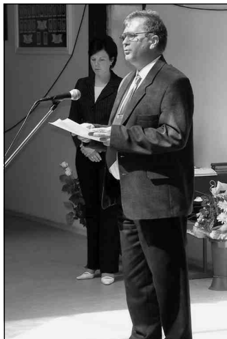
Hatvani Miklós polgármester

Minden isaszegi lakos, család nevében köszönjük, hogy gazdagabbak, értékesebbek lehettünk ezzel az intézménnyel. A korsze-