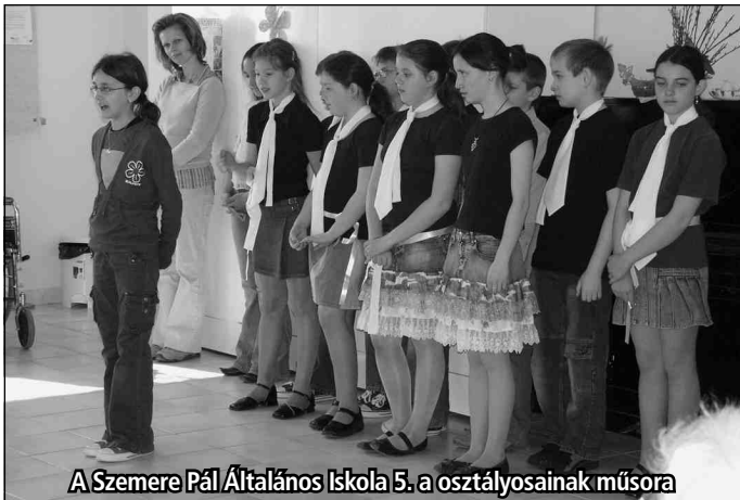
A Szemere Pál Általános Iskola 5. a osztályosainak műsora