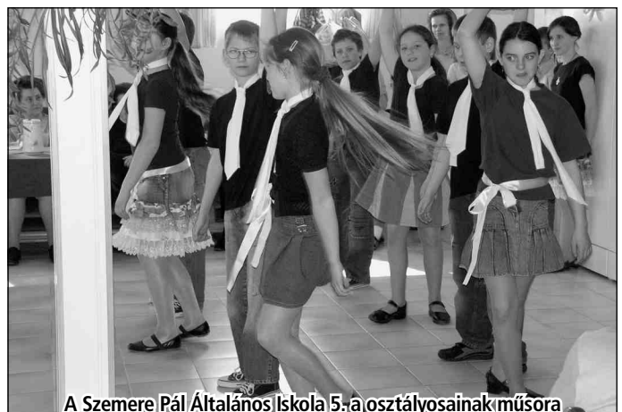
A Szemere Pál Általános Iskola 5. a osztályosainak műsora

Klubunk munkanapokon 7.30-tól 16 óráig tart nyitva, a fenti programok, előadások 10.30 órakor kezdődnek, melyekre mindenkit szeretettel várunk. Előzetes egyeztetés alapján fodrász, kozmetikus, pedikűrös szolgáltatás igényelhető kedvezményes térítési díj ellenében. Lehetőség van ingyenes vérnyomás- és vércukorszint mérésre.