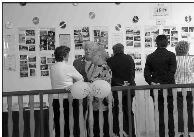
Pillanatkép a kiállításról

Szolgáltatásunk, szolgálatunk lényege, hogy közvetítsük a valóság legkülönbözőbb arcait az észlelés és tudás legváltozatosabb formáin keresztül. Ez az iskola tudja azt is, hogy a legfontosabb modernizációs feladata felkészíteni a tanulókat az informatikai eszközök használatára, és emberléptékű környeze-