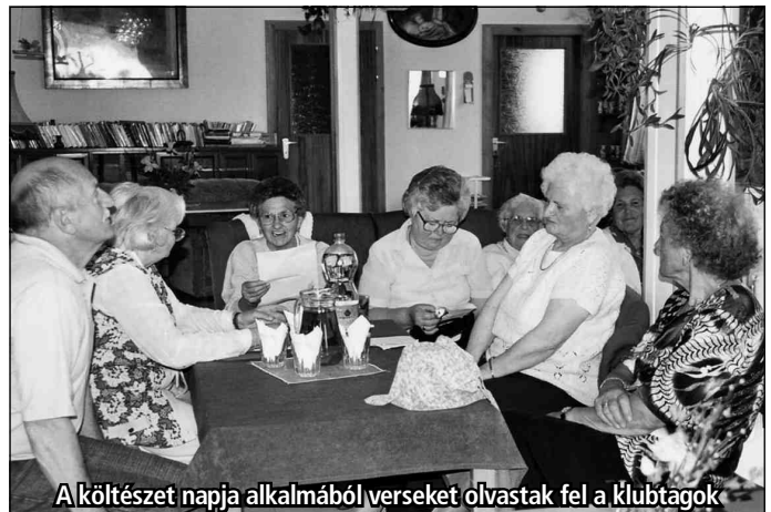
A költészet napja alkalmából verseket olvastak fel a klubtagok