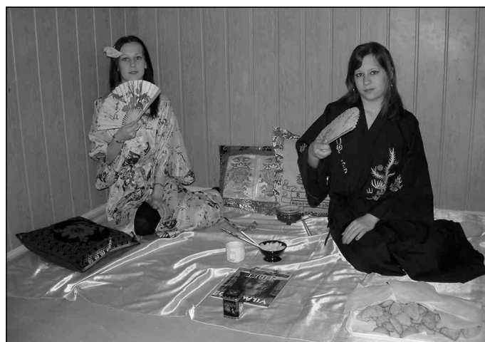
Az „Utazás a Föld körül” verseny egy pillanata

tet teremteni a tanuláshoz, a gyerekek már megvannak hozzá. Megtanultuk az elmúlt tíz év alatt, hogy mi a különbség a hagyományos és a modern iskola között. A mindennapi pedagógiánkban egyénre szabottan, igény szerint, diákcentrikusan tevékenykedünk, szem előtt tartva a kor kihívásait, mert tudjuk, hogy az egységesülő európai felsőoktatási térségben és az egységessé váló munkaerőpiacon e nélkül esélytelenek lennénk. És mivel az iskola, amit álmodtunk magunknak, a jövő iskolája, nem rest szétnézni a világban, és azt is tudja, csak így szeresheti