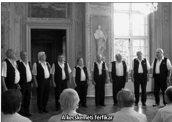
A kecskeméti férfikar

Monoron a Strázsa-hegyen van Európa egyik legnagyobb regisztrált pinceegyüttese, 970 borospincével. Az egyik jeles bo-