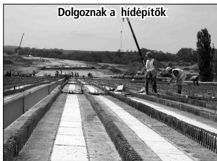
Dolgoznak a hídépítők

Pécel és a XVII. kerület között a Péceli úton egy nagy csomópont épül. Itt a Péceli út felüljáróban keresztezi az M0 nyomvonalát, illetve lehetőség nyílik egyúttal a le- és felhajtásra a gyorsforgalmi út mindkét irányában. Miután elkészül a felüljáró,