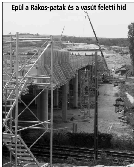
Épül a Rákospatak és a vasút feletti híd

Az M0 keleti szektorának építése folyamatos. A kivitelezők nagy erőfeszítéssel dolgoznak, így május végére a PVT-M0 Konzorcium – mely a Pécel környéki szakasz építője is – közel ötven százalékos készült-