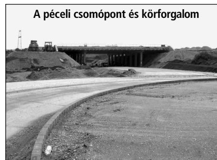
A péceli csomópont és körforgalom

akkor a kivitelezők ráterelik a Péceli út forgalmát. Ez a forgalomterelés várhatóan július vége és augusztus közepe táján történhet meg.