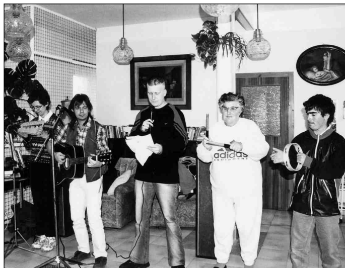
Alemny Erzsébet Segítő Ház fiataljaiból és segítőikből alakult együttes