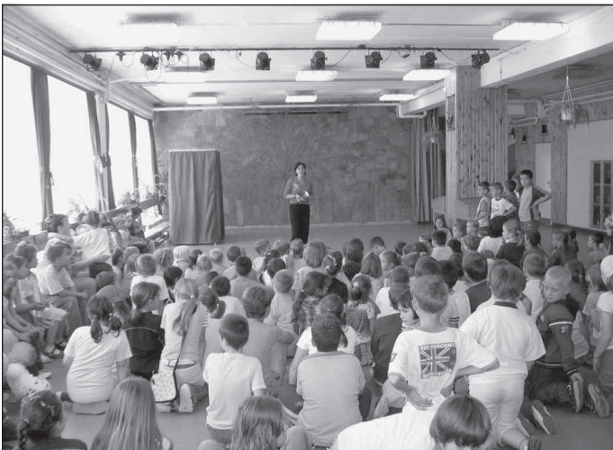
Sokan várták érdeklődve a színpadra lépőket

A délután legfőbb mozzanata a mustkészítés volt. A szülők által adományozott gyönyörű szőlőfürtöket a gyermekek először megmossák, megízlelték, majd ledarálták, és a présbe tették. Felváltva tekerték a darálót, húztak egyet-egyét a présen, majd ámulattal nézték az edénybe csordogáló ízletes nedűt.