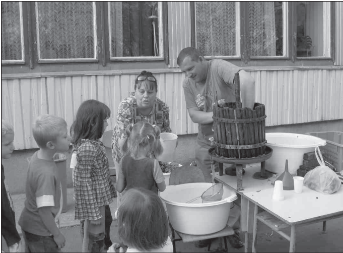
Közös munkával készül a must

A minden évben megrendezésre kerülő mulatságot az iskola napközis nevelői szervezték. A rendezvény lebonyolításában minden alsó tagozatos tanító részt vett. A tanév kezdetétől