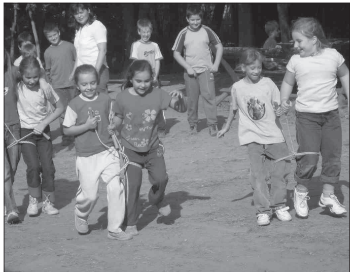
Az ügyességi játék vidám percei

A mulatság nem is igazi mulatság énekszó és tánc nélkül. A