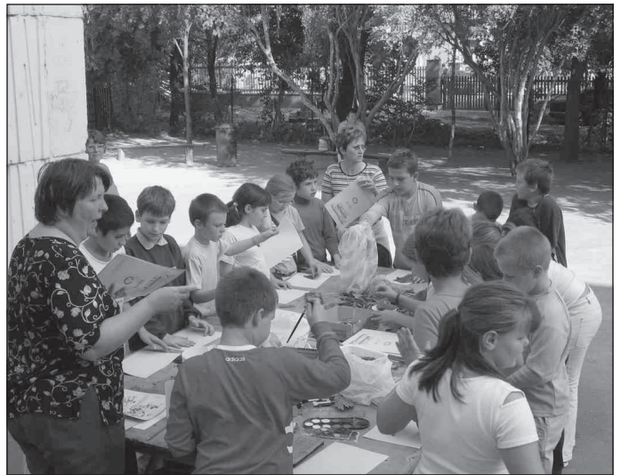
A kézműves foglalkozás résztvevői

Vitathatatlanul a szüret ezen mozzanata volt a legkedveltebb a diákok körében. Ezt talán csak a préselés eredményeképpen keletkezett finom must kóstolása múlta felül.