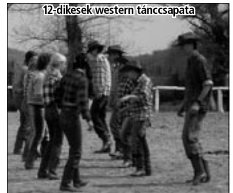
12-dikesek western táncscapata