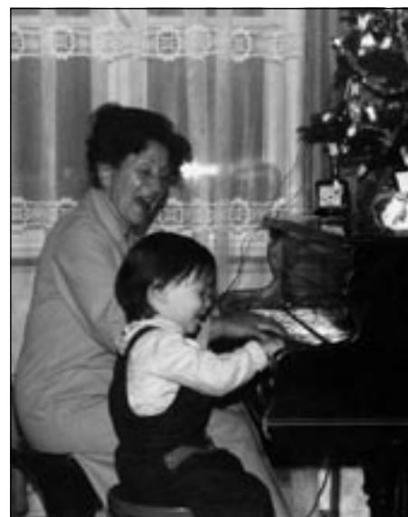
Vidám éneklés a kis unokahugával

gyerekek is bekiabáltak, miért nem érti Maki. Ha kellett megdicsérték, és meg is szidták. Mert Maki nem figyelt, néha rossz volt, Maki nem mindenre emlékezett. Azért kellett neki sokat ismételni ... – és Maki előkerült a kosár aljáról. Bizony még ma is nagyon izgága, de illendően köszöntött, és bemutatkozott. Aztán visszakerült a helyére, és folytattuk a beszélgetést. – Keresztanyámtól kaptam nagyon-nagyon régen, már sokszor megvarrtam, átrajzoltam a száját.