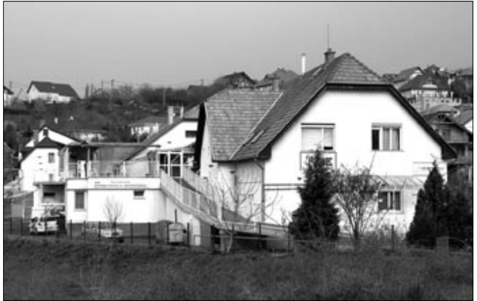
ESE Szociális Központ, Pécel

Az Egymást Segítő Egyesület történetéről, valamint a Pécelen és Isaszegen folyó sokrétű tevékenységeinkről, szolgáltatásainkról az ESE Híradó archívumában és egyesületünk honlapján ( www.egymast-segito.hu ) olvashatnak részletesebb tájékoztatást.