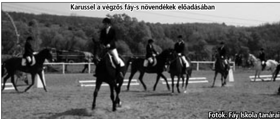
Karussel a végzős fáy-s növendékek előadásában