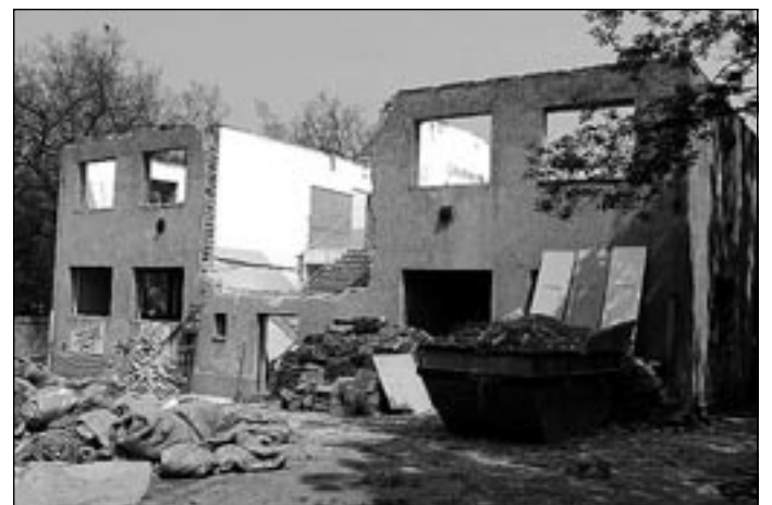
A nyolctantermes lecsupaszított falai

– Ezek szerint az iskola és a pedagógusok adminisztrációjára nem is nagyon maradt helyiség.