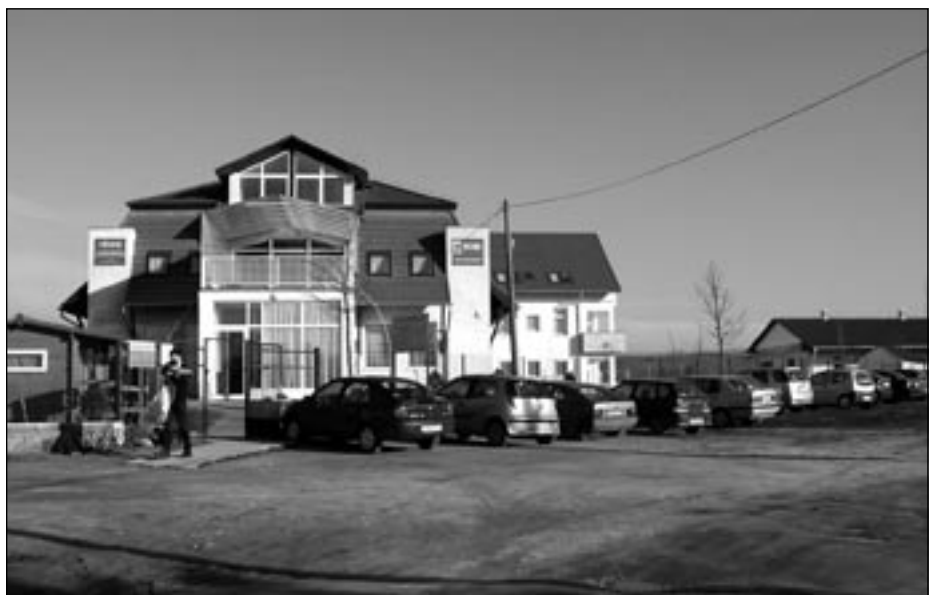
ESE Alemany Erzsébet Segítő Ház, Isaszeg