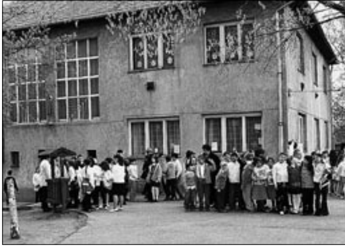
A régi épület előtti utolsó fényképezkedés

Az építésvezetővel a következő lépést már megterveztük. Újabb udvari területet adunk át, hogy a második ütem alapozási munkái