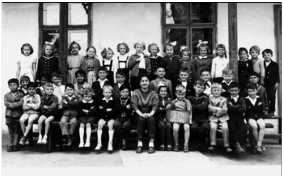
Első osztály 1961-62. tanévben a Kálvin téri iskolában

Nem bírtam sokáig, fél év múlva visszajöttem Pécelre. A Kálvin téri iskolában kezdtem el működésemet. Hogy 1948-ben vagy 1949-ben, nem is emlékszem pontosan... Arra azonban jól emlékszem, hogy tíz éven keresztül nem kaptam jutalmat, mert a papám tisztviselő volt, ezért osztályidegennek számítottam, és a gödöllői pártvezetők mindig lehúztak az előterjesztett listáról. Így volt ez akkor, a Rákosi-időben. Aztán egyszer váratlanul jött a