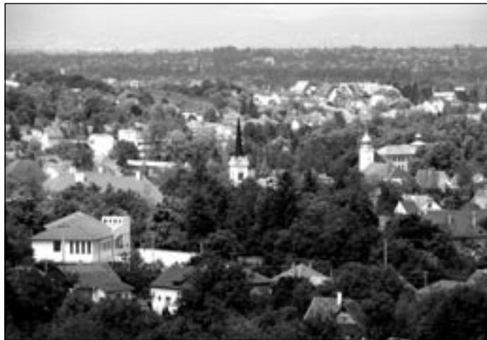
Pécel látképe napjainkban

Többen tudják már, most mégis elmondom újra a Kelemen-ház történetét. A Kelemen-ház a Maglódi úton volt, és teljes mértékben csak volt, mert nyomtalanul lebontották. Ezzel eltűnt