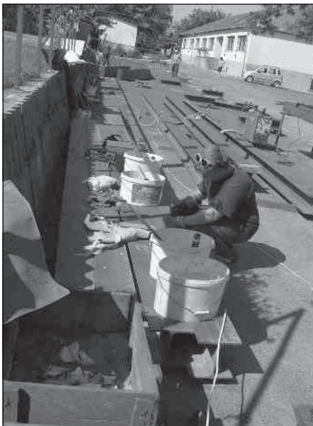
A fém gerendák hatalmasak