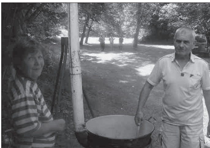
Köszönjük a vendéglátást!

Tavaly nyáron meghívást kaptunk két nagyon aranyos családtól a Pécel mellett lévő Jakabffy tanyára. Mint már erről tavaly októberi számunkban beszámoltunk, ennek a tanyának a szépsége, gondozottsága, „vendéglátó” terasza lenyűgöző, nem beszélve a