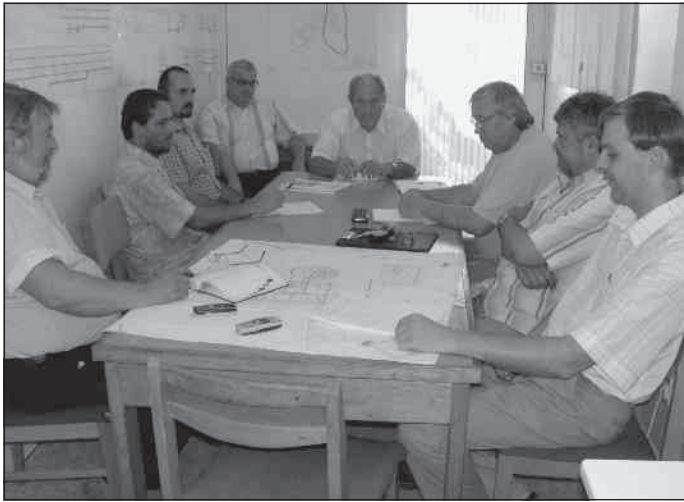
Egyeztetnek a szakemberek