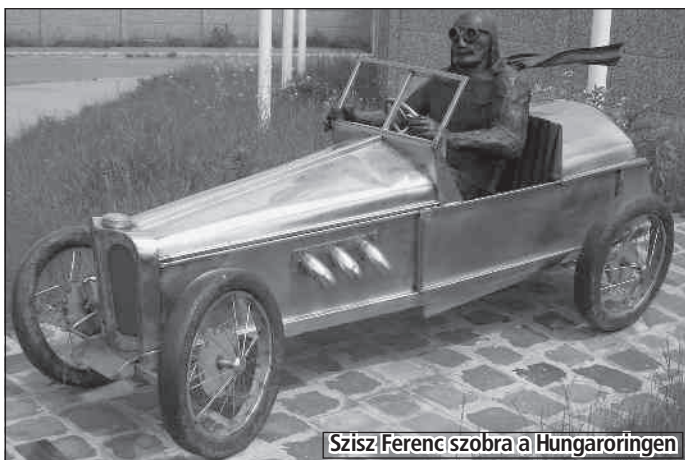
Szisz Ferenc szobra a Hungaroringen

Hogy ki győz, igazán lényegtelen. Az a fontos, hogy emberéletben ne essen kár, és minden a forgatókönyv szerint bonyolódjon le. Legyen elég fizető néző, telt ház tábla lógjon a szállodák aijtáján, vigyék a vendégek Magyarország jó hírét. Ha valakinek tetszett az ittlét, jöjjön vissza versenytől függetlenül is. Tanuljanak magyar szavakat és neveket. Ne csak a puszta vagy a gulyás szavakat és ne csak Puskást és Rubikot ismerjék, hanem például Szisz Ferencet (1873-1944) is, akinek a mogyoródi pálya főbejáratánál 2003-ban szobrot állítottak, és a pálya első (jobb) kanyarja viseli nevét.