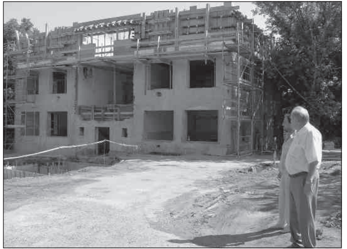
A nyolctantermes épületére hamarosan tető kerül