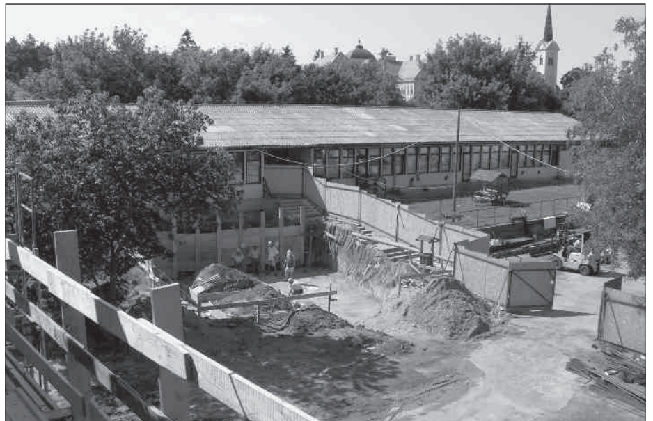
A forra előtti alapozási munkák