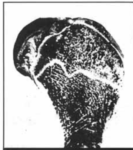
Csontritkulás. A szivacsos csontállomány erős felritkulása

A csontritkulásos betegség másik fő töréstípusa az alkarcsonttörés. A gyógyulás lassabb lehet súlyos csontritkulásban szenvedő betegeknél. A kézfej, ujjak duzzadása esetén vagy ennek megelőzése céljából háromszögletű