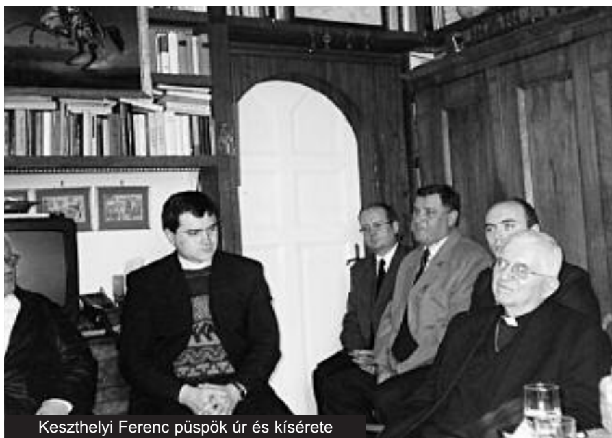
Keszthelyi Ferenc püspök úr és kísérete