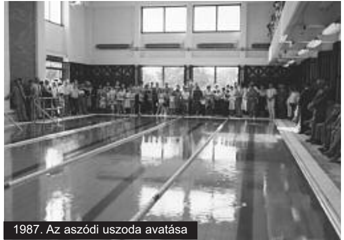
1987. Az aszódi uszoda avatása

Hatvanöt évesen nyugdíjba mentem, is-mét haza kerültem. Azóta is aktív életet élek immár családom javára is. A lányaimnak adtam azokat a telkeket, melyeket munkás éveim során vásároltam. Az egyik, itt a Pihenő utcában van egy kis szőlő, azt művelem, jó bort termelek, borversenyen első díjat nyertem. Rend-szeresen olvasok és írogatok újságcikkeket, elsősorban helytörténeti vonatkozás-úkat. Nagy fájdalom az, hogy itt Pécelen a mai napig nem sikerült kiala-kítani egy helytörténeti gyűjteményt,