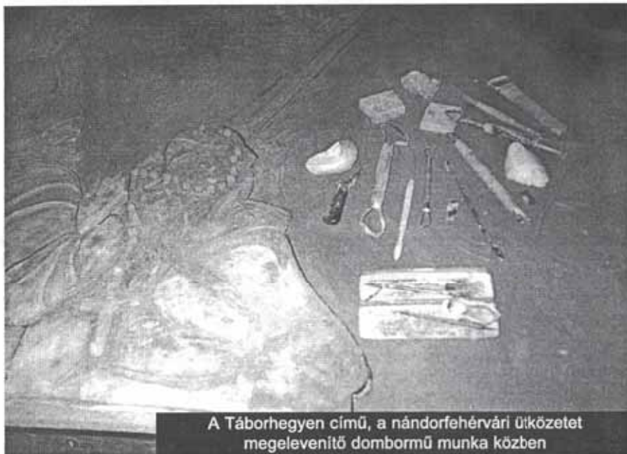
A Táborhegyen című, a nándorfehérvári ütközetet megelevenítő dombormű munka közben

– Kalandosan. A Művészeti Alap megszünt, ezzel az Alaphoz tartozó művészek minimális létbiztonsága is. Önkén-