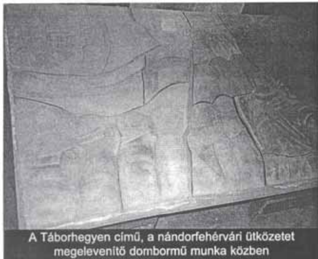
A Táborhegyen című, a nándorfehérvári ütközetet megelevenítő dombormű munka közben

– Optimista, reménykedő, pozitív szemléletből fakadnak. Mindenben, mindenkiben az előnyös tulajdonságot felszínre hozni, igazán művészi és emberi feladat. A valós és transzcendens lét azonos helyzetbe hozása egyazon lelki folyamatban megy végbe ben-