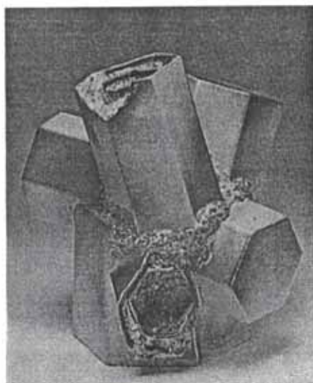
Kristály 1999., porcelán applikáció

nünk. Mosogatás közben rózsákat is tudunk látni a szivacson. Már csak meg kell formázni. Én agyagból próbálom, nekem ez az eszközöm a csodákra. Másnak más, de ez igazán nem változtat a lényegen.