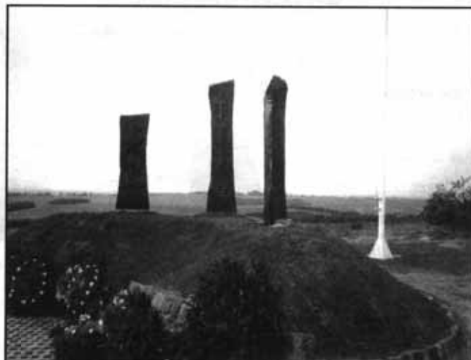
A 2001. május 19-én átadott II. világháborús emlékpark, amit 1944. november-december hónapjában Pécel határában elesett magyar katonák emlékére készítettek.