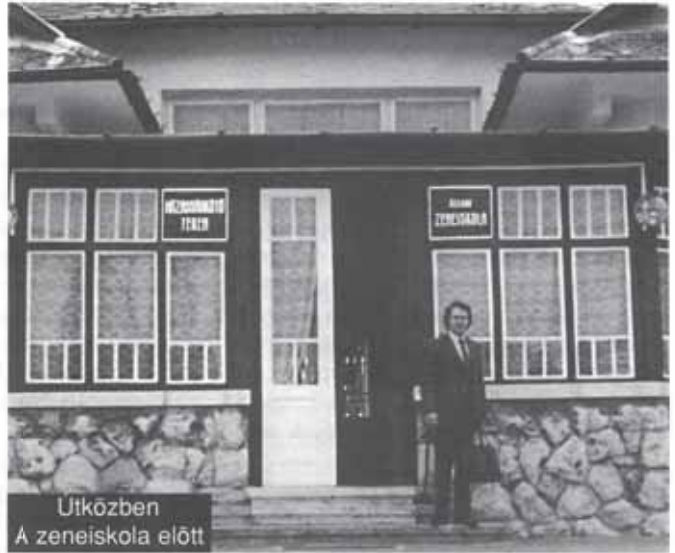
Utközben A zeneiskola előtt

Most, anyák napján lett volna édesanyám 80 éves. Felerősödtek bennem az emlékek. Édesanyám már nem élt, amikor a két testvérem elment. Kegyelmet kapott. Szavait, dalait, mozdulatait lelkiismeretemben őrizem.