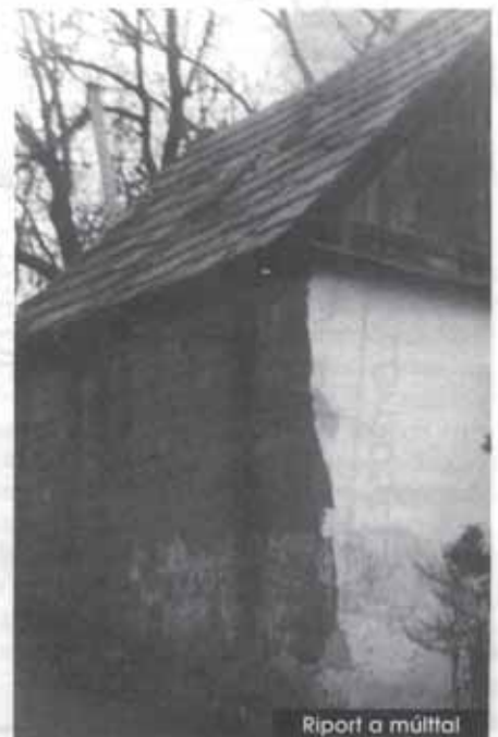
Riport a múlttal