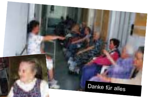
Danke für alles