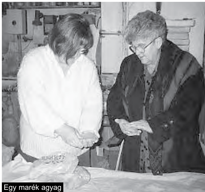
Egy marék agyag

A kerámia a tűz ősi rítusával varázsol. Alkotó társad a tűz. A formálódó agyagtárgy elnyeli alkotóját, a lelkét, a gondolatát, az akaratát, de még mindig csak tárgyról beszélünk, amely ha nem kapna tüzet, elpusztulna. A keramikus az agyag tárgyát áldozattal felajánlja a tűznek. A tűz nem pusztít, hanem örökévé teszi az agyagtárgyakat a lelkeddel együtt. A keramikus ki van szolgáltatva a tűznek, ezért meg kell ismernie a tűz természetét. A kerámiaművészet a képzőművészetten belül nemcsak technikailag önálló művészeti ág, hanem másként eleveníti meg a szépséget az ember számára.