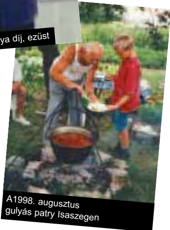
A 1998. augusztus gulyás patry Isaszegen