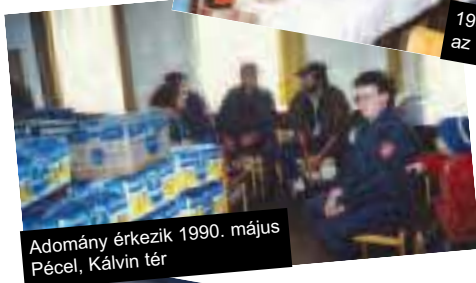
Adomány érkezik 1990. május Pécel, Kálvin tér