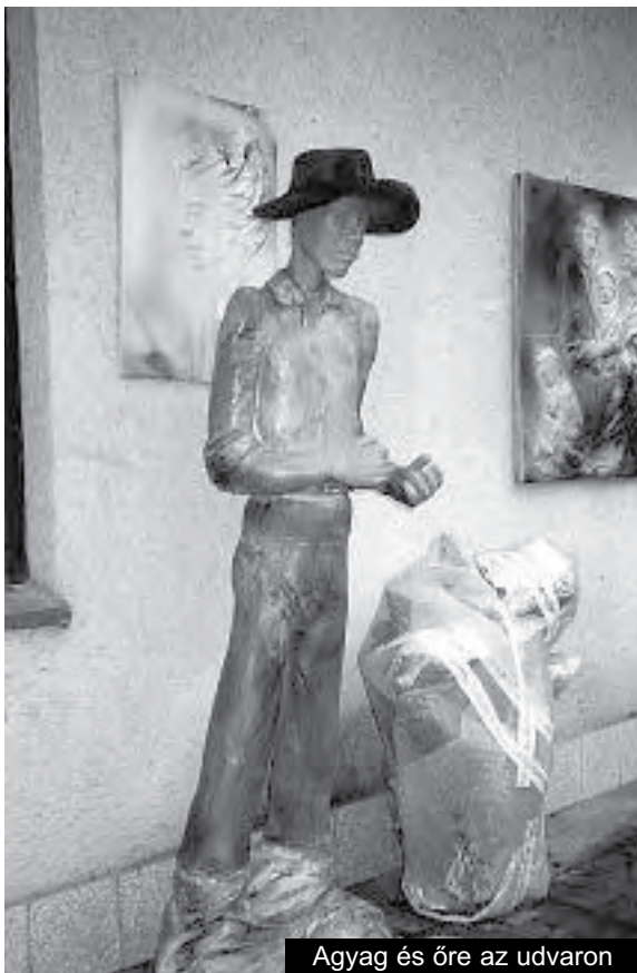
Agyag és öre az udvaron