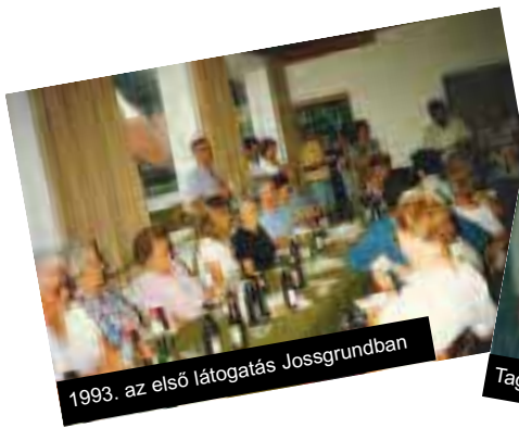
1993. az első látogatás Jossgrundban