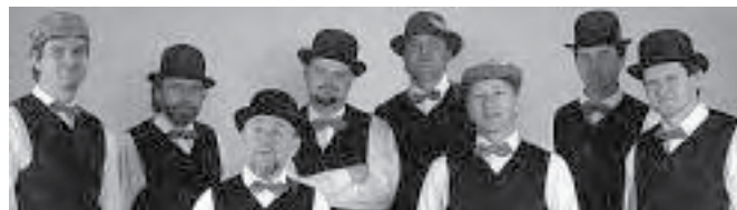
A Budapest Ragtime Band Pécelen

„A Budapest Ragtime Band 1980-ban alakult főiskolát végzett jazz- és klasszikus muzikusokból, akik a hagyományos ragtime zongorajátékot merész ötletekkel és újszerű hangszerezéssel ültették át egyedülálló zenei hangzássá. Később műsorukba jazz- és dixielend-örökzöldek, a világon egyedülálló zenei paródiák, ismert slágerek és operák humoros feldolgozásai is kerültek. A zenekarnak tánczenei programja is van. 1984-ben készült el a „Ragtime”, a zenekar első önálló hanglemeze, amelyet egy hollandiai és egy újabb magyar követett. A zenekarnak 1990 óta öt CD-je jelent meg. A zenekar számos stúdiófelvétel mellett rendszeresen turnézik Európa országaiban, Amerikában és a Kanári-szigeteken. Résztvevője rangos fesztiváloknak a világ minden részén. Fellép a Berliini Filharmóniában, rendszeres szereplője a magyar, német, az amerikai a svájci stb. televíziók