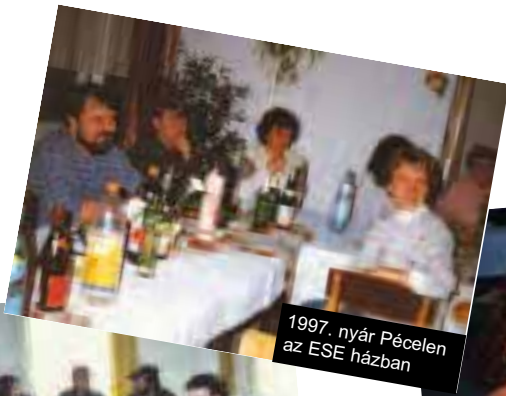
1997. nyár Pécelen az ESE házban