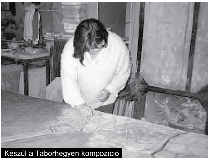
Készül a Táboregyen kompozíció