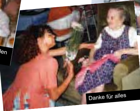
Danke für alles