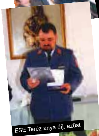
ESE Teréz anya díj, ezüst