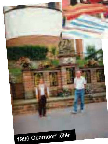
1996 Oberndorf főtér