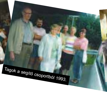
Tagok a segítő csoportból 1993.