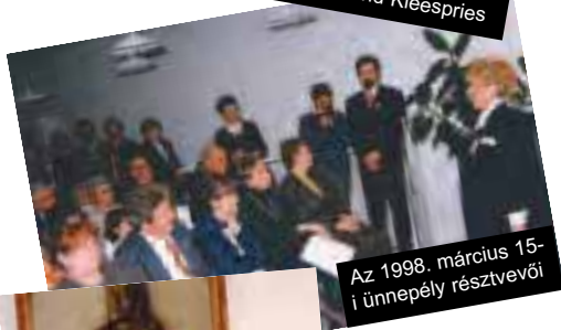
Az 1998. március 15-i ünnepély résztvevői