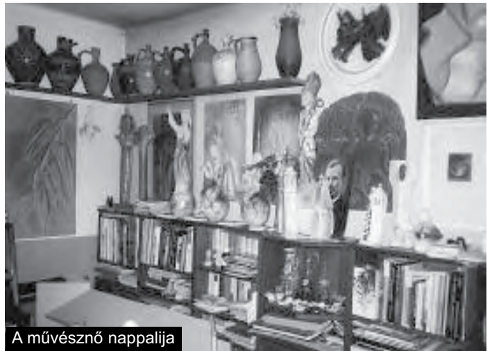
A művésznő nappalija

– Tulajdonképpen igen. De nem bírtam a követ megfaragni. Fájt a csuklóm. Idegen volt a kő, mint anyag. Nem fogadott szót nekem, nem ott tört, ahol akartam. Az agyag! Az egészen más. Rendkívül gyorsan formálódik nekem! A fejemben abszolút rend van, amikor agyaghoz nyúlok. Az idő ahhoz kell, hogy a fejben rend legyen. Akkor gyorsan működünk együtt az agyaggal. Persze nem mindig sikerül, de az felismerődik. Jó lelkiállapot kell – nem nevezném ihletnek -, amikor sikerülhet. A Zeneiskola képe volt valami fantasztikusan