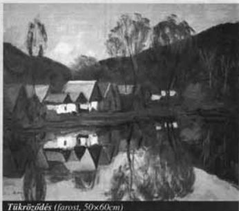
Tükröződés (farost, 50x60cm)