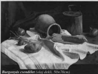
Burgonyás csendélet (olaj dekli, 50x70cm)