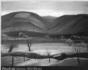
Péceli táj (farost, 60x80cm)