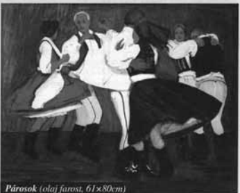
Párosok (olaj farost, 61x80cm)

Az 1996 júliusában-augusztusában várossá avatott településünkön – sok egyéb mellett – nincs állandó kiállító terem (persze hiányt szenvedünk az egészségügyi ellátás és az élet számos egyéb területén, a minimális szintű ellátottság terén is). Született korábban néhány, eleve elutasításra ítéltetett elképzelés: úgymint a rendőrség épületének egy szintje, vagy a Ráday Kastély melléképületének egy része vagy a Művelődési Ház északi frontján álló üres lakás faluműzeumkénti hasznosítása, de az anyagiaknál jobban, talán az akarat, a jó szándék hiányzott.