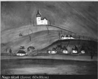
Nagy tűzek (farost, 60x80cm)