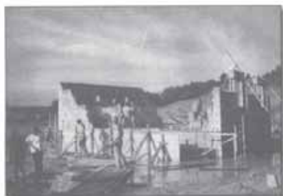
1991. augusztus 14. Holland fiatalok és az "ESE ház"