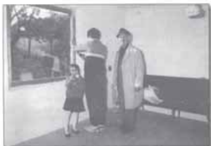
1990. november 2. Pécel Határ u. 9. Az első felépített ház