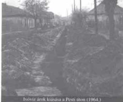
Ivóvíz árok kiásása a Pesti úton (1964.)

Az emberi élet két nélkülözhetetlen alapszükséglete a levegő és az egészséges ivóvíz. A levegő adott. A víz szintén, de azt külön meg kell „szerezni”. Nem véletlen, hogy az emberi települések kialakulása általában patakok, folyók közelében kezdődött. Így volt ez Pécelen is, ahol a kanyargós Rákos-patak lankás, dombokkal övezett völgye igért jó települési helyet.