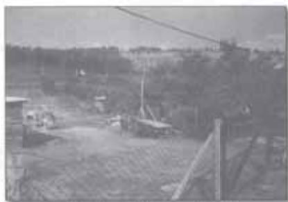
1991. június Pécel „Rózsadombja”, és az "ESE épületének" helye