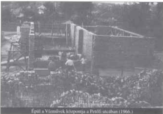
Épül a Vízművek központja a Petőfi utcában (1966.)